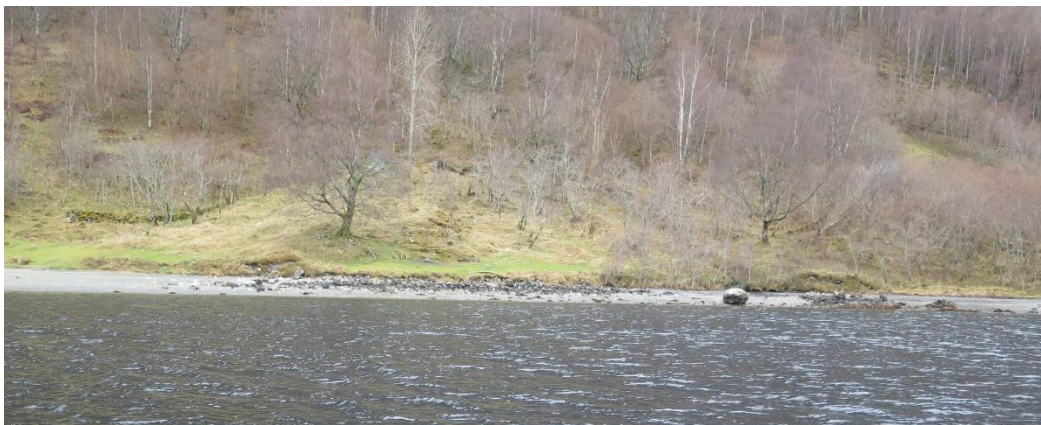
Bakkemur framfor jordbruksareal.