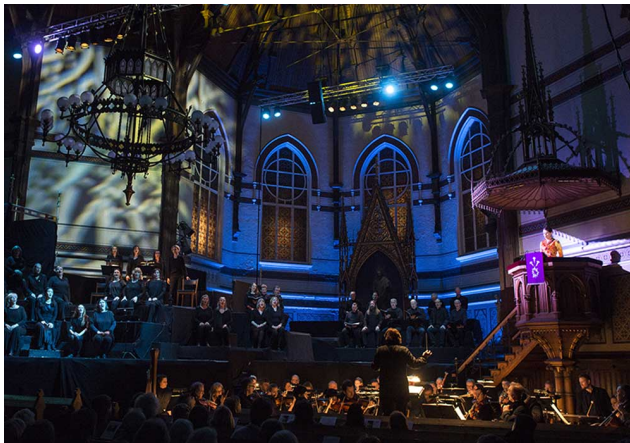
The Music Makers/Elgar og Requiem/Mozart – visualisert vokalsymfonisk i Johanneskirken