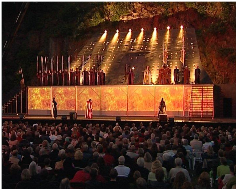
Aïda på Koengen 2005

Kompaniet var i 1995 først ute i landet med utendørs, klassisk akustisk opera i sommersesongen – den gangen med Nabucco på Bergenhus Festning. Foretagendet ble en stor publikumssuksess, og viste seg som en betydningsfull måte å bygge publikumsgrunnlag for kunstarten, og har også fått arvtakere mange steder i landet.