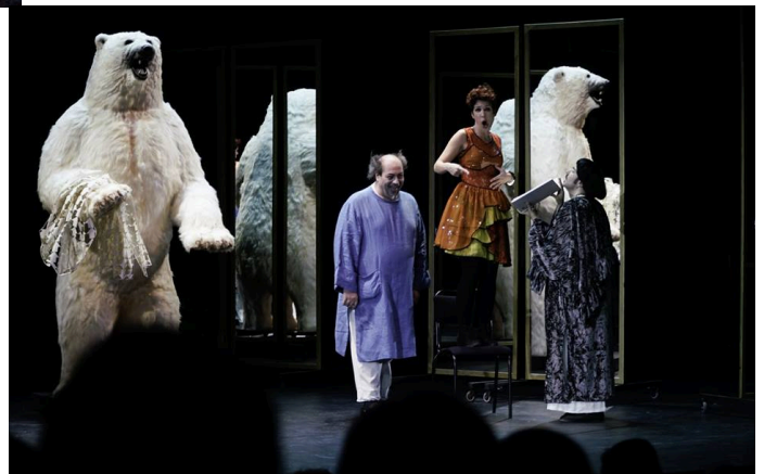
Barberen i Sevilla/Rossini – fullscenisk på DNS, produsert for Festspillene og på turne i Nord Norge