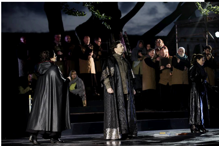
Nabucco/Verdi – fullscenisk sommeropera på Bergenhus Festning