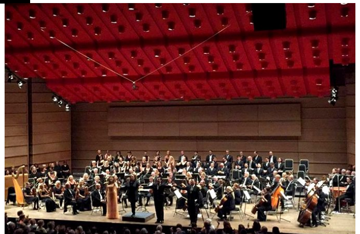
Wiener Staatsopernchor Vestlandsturné Øvre Årdal – Haugesund – Bergen