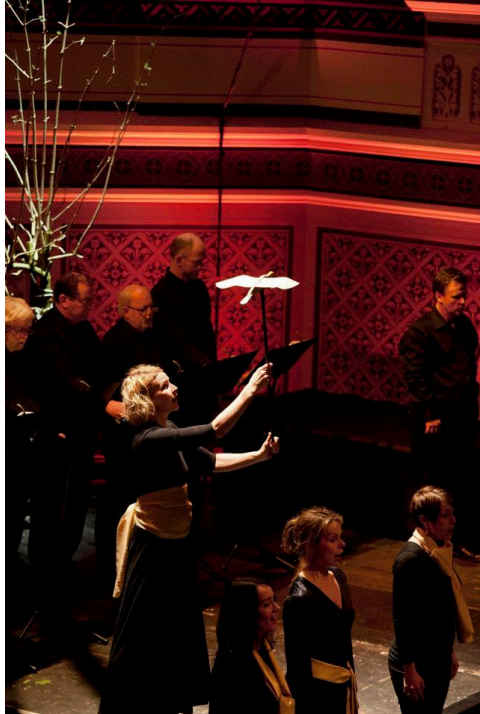
Stabat Mater/Dvorak – visualisert vokalsymfonisk i Johanneskirken

Sommeropera på Bergenhus Festning – Samarbeid med Mozarteum, Salzburg