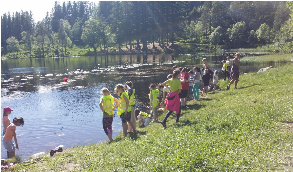
Felles BARK sommeravslutning på Fløyen