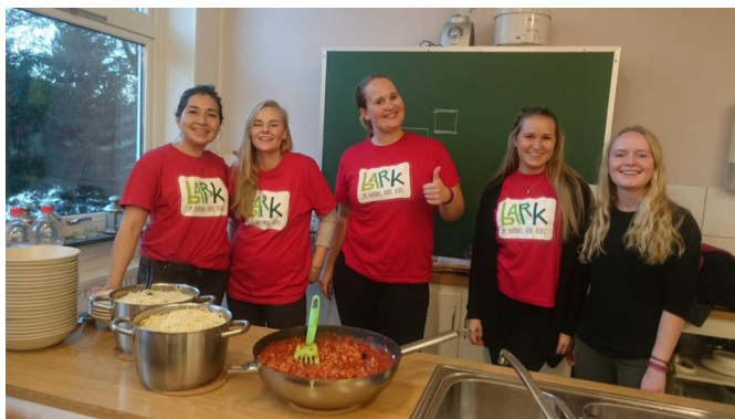
Kjøkken og spillekveld på BARK Sletten. Barna laget spaghetti og kjøttdeig, her er de frivillige klar til å servere