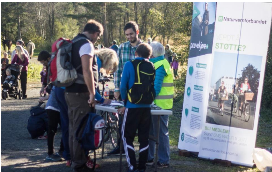
Deltakere fikk lære om miljøvennlige reisevalg, og fikk tilbud om å prøvekjøre elsykkel i Hordnesskogen 2. oktober.

I tillegg til å lære om verdier i sin nærnatur, fikk deltakere i Hordnesskogen lære om klimaeffekter av transportvalg på individ- og samfunnsnivå. Naturvernforbundet Hordaland fortalte om behovet for en bærekraftig utvikling som ivaretar hensyn til naturmangfold og globale klimamålsetninger, både i valg av plassering av godsterminal i Bergen og i valg av transportmiddel når man reiser til jobben.