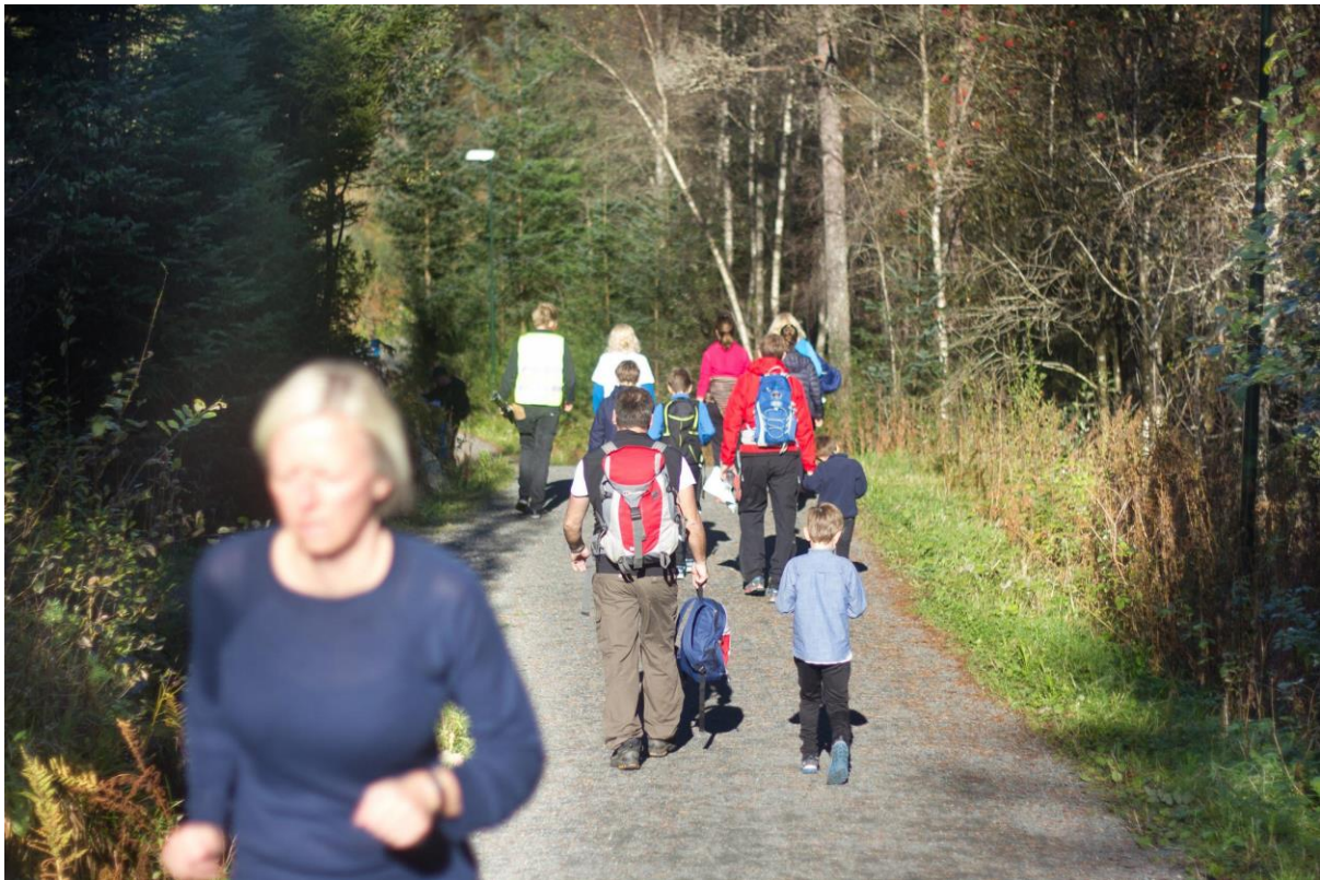
Barn og voksne i Hordnesskogen på aktivitetsdagen arrangert i samarbeid mellom Hordnesskogens Venner og Naturvernforbundet Hordaland.