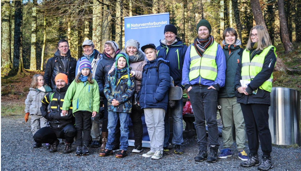
De polske deltakerne på arrangementet Naturglede på Fløyen , i samarbeid mellom Naturvernforbundet Hordaland og Propter Familia.

Siden Friluftslivets år 2015, har Naturvernforbundet Hordaland gjenopptatt tradisjonen med å arrangere nærmiljøturer for å gjøre flere kjent med naturmangfold, spre naturglede, få nye naturinteresserte med på tur, og skape rom for deltakelse på tvers av aldersgrupper og kulturer i Hordaland. Vi ser tilbake på et innholdsrikt år med naturglede, og vil med dette takke for støtten fra Hordaland Fylkeskommune og Miljødirektoratet som har muliggjort videreføringen av prosjektet i 2016. Her følger en rapport over prosjektaktiviteter for Naturglede Hordaland 2016. Første del av rapporten beskriver hvordan aktiviteter ble planlagt, annonsert og tilrettelagt for å nå ønskede målgrupper. Andre del skisserer prosjektaktivitetene med bilder, og gir en begrunnelse av avvik fra opprinnelig projektskisse. Viser til epost 13.12.2016, med avtale om ettersending av prosjektrekskap innen 15. februar 2017. Alle bilder av barn er godkjent for bruk av foresatte.