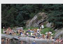
Reiseliv / Grønevika.

Allemannsretten er et grunnleggende og et viktig grunnlag for den norske friluftslivskulturen. Den gir alle rett til å gå og ferdes i naturen, og det er ikke tillatt å gjøre skade eller forurening. Det er ikke tillatt å gjøre skade eller forurening. Det er ikke tillatt å gjøre skade eller forurening.