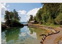
Hytta i Sandholna og områdene rundt er godt egnet som dagstunell for barn og voksne.

Bergen og Omland Friluftslivstiftelsen (BOF) er et frivillig organisert samarbeid mellom de tre kommunene Bergen, Sandnes og Grønevika. Stiftelsen har ansvar for friluftsliv og utvanning i området.