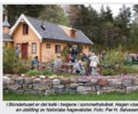
I Blomsthuset er det kaffe / halvpensjon / oppsett for en utstilling av historiske fotografier.

Sandholna er et bad- og turmål med 700 m strandlinje med Panfjellstua. Området er spesielt viktig for barn, med en innviddelt gå-på-3:0-øst, utgang og oppover til friluftssenteret. Hytta i Sandholna kan søkes til dagstansovernatt, ved å kontakte Friluftslivstiftelsen.