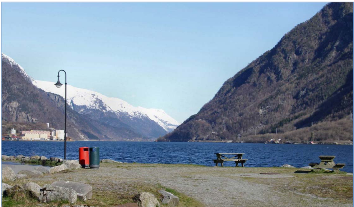
Kystvatn i Hardanger vassområde (Sørfjorden)

Hausten 2014 er det planer om å starte opp eit tilsvarande arbeid for kystvatn i vassområde Nordhordland.