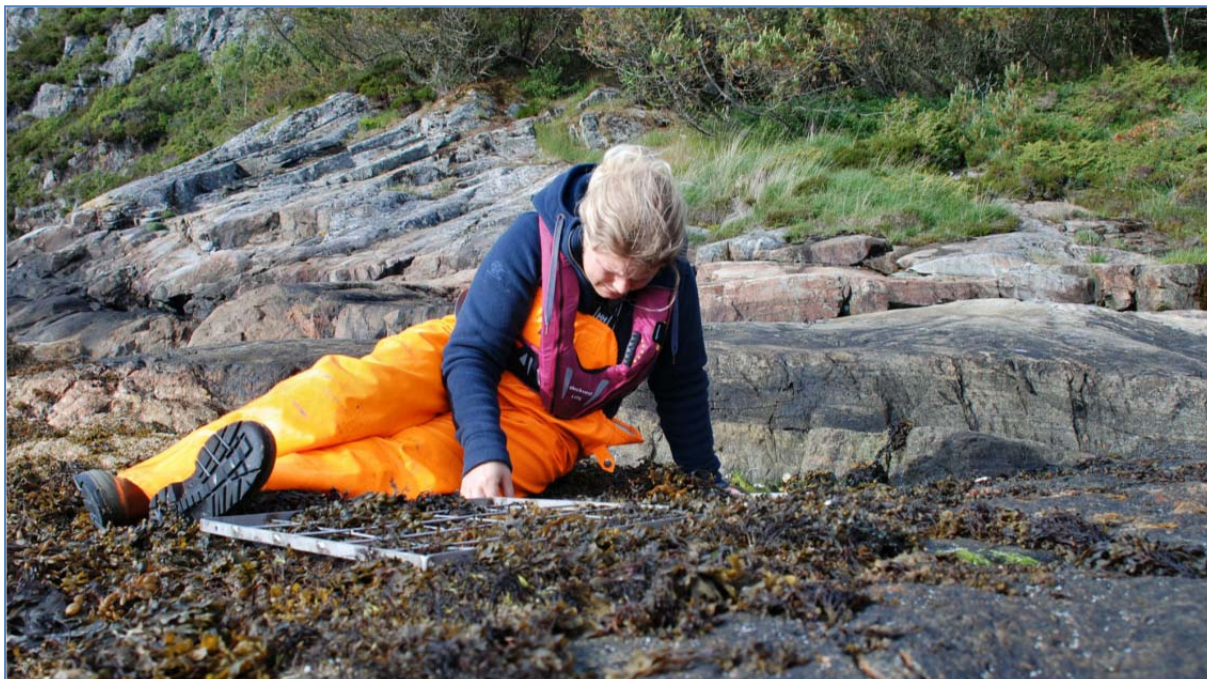
Økologisk kartlegging i strandsona i kystvatnforekomst

Desse tabellane kan ein lese i eige oppslag på www.vannportalen.no/hordaland . Der er det også forklart kva metode som er nytta for å utforme overvakinga. I oppslaget er det også kart som viser kvar det er foreslått ulike slag av overvaking.