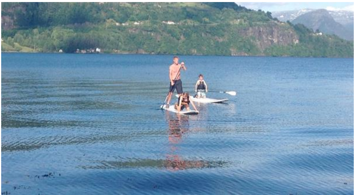
Stå på fjorden og SUP i veg!