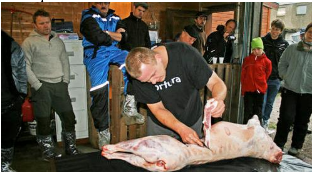
Slakting av sau med kyndige lokale heltar