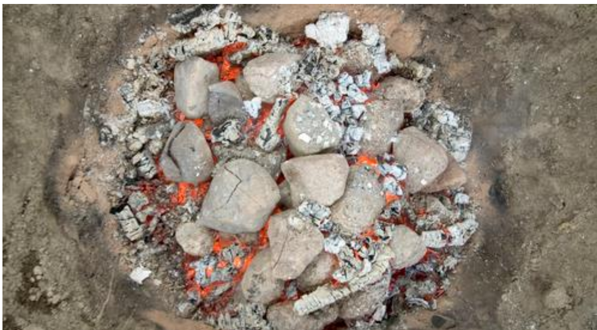
Tilverking av mat på steinaldervis. Gropakoking av lammekjøtt!