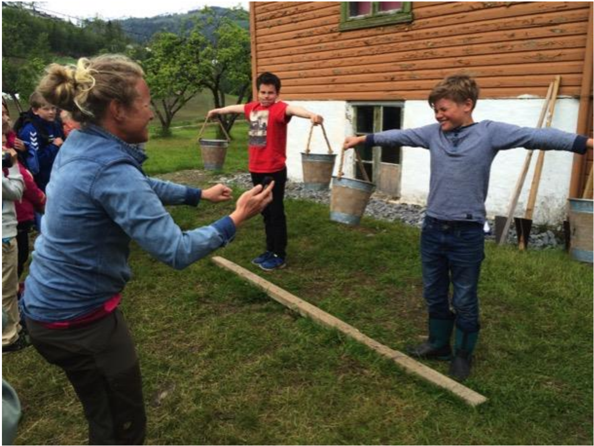
Ein vinnar skal kårast i HardingMeister