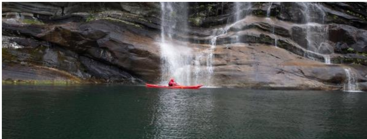
Opplev Fykkesundet med kajakkar og dyktige instruktørar