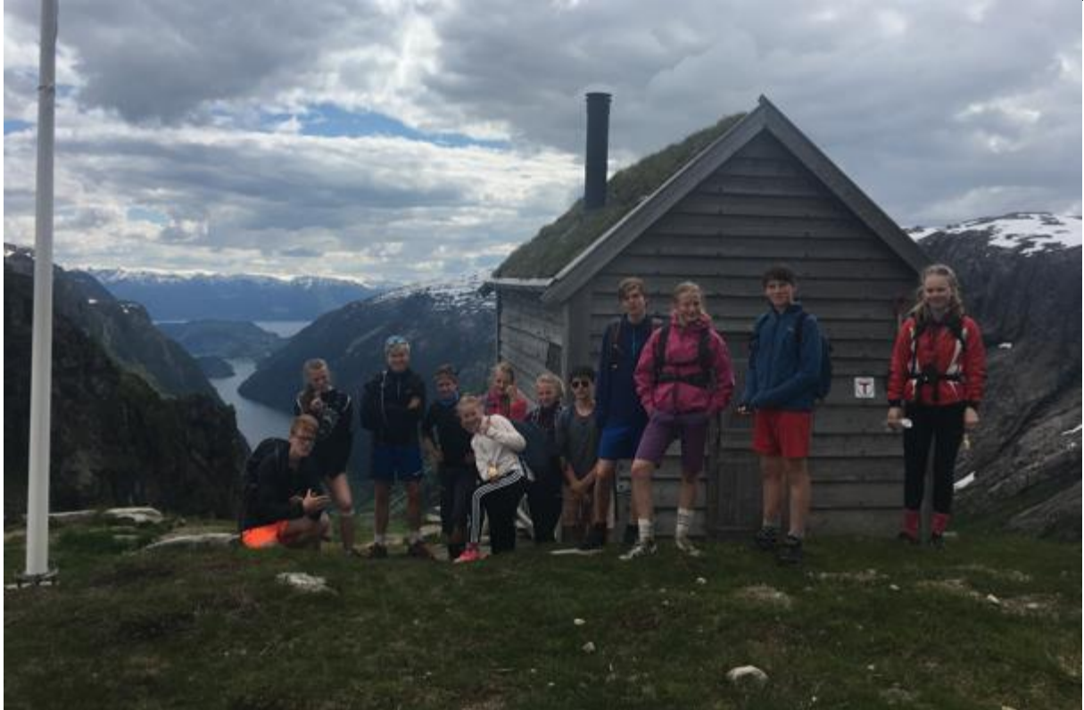
Felles vandring gjennom velstelt kulturlandskap og opp i fjellet.