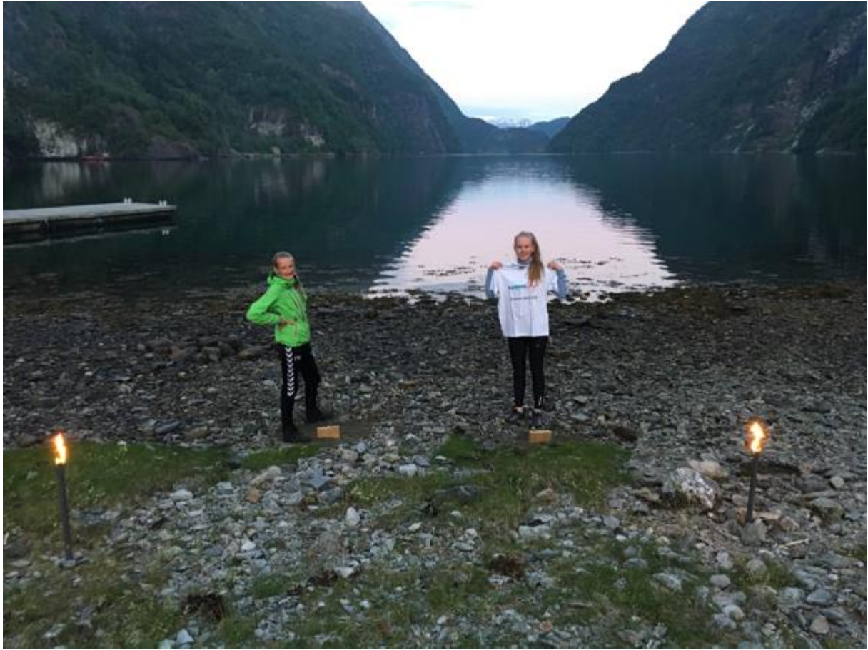
Ein vinnar skal kårast i den fredelega kappestriden HardingMeister