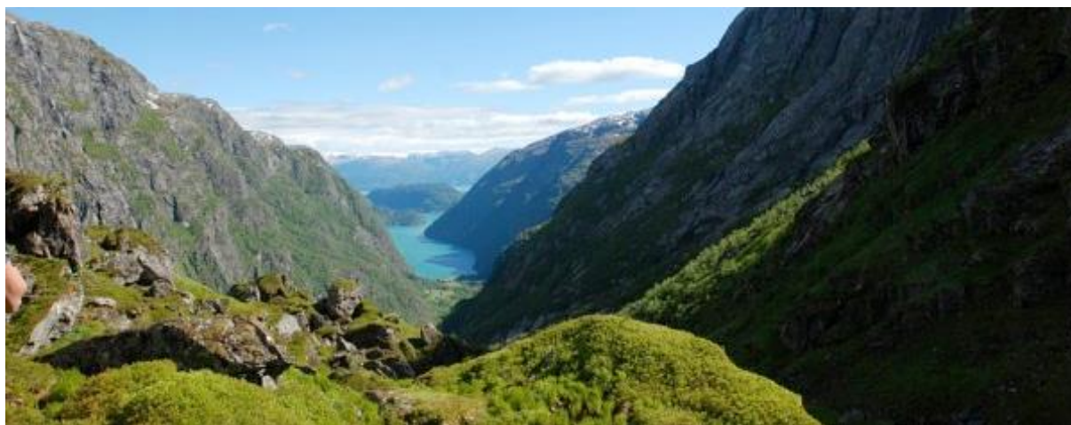
Unike naturopplevingar i Fykkesundet og på Botnen, ein av få veglause grender i Noreg. Båttokt forbi velstelt kulturlandskap og ville fjellsider. Overnatting på nedlagd skule i grenda og tur til Kiellandbu med mektig utsyn ut fjordarmen