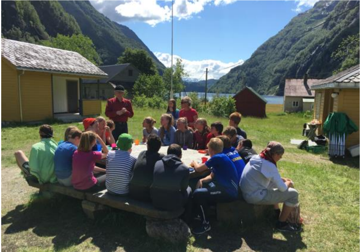
Formidling om livet på Botnen i hine hårde dagar