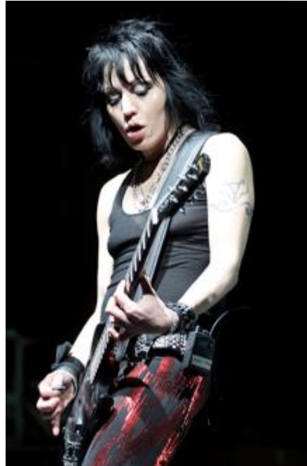
Innføring i rockens historie 1928 – 2017 og samla studiosession!