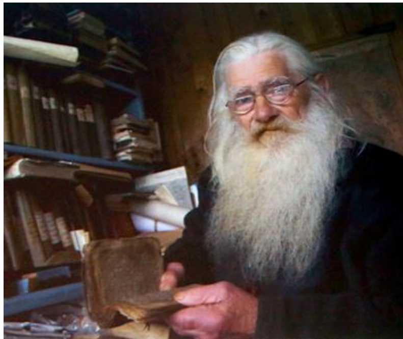
Soga om hardingfela frå Botnen og saga om Skårømannen