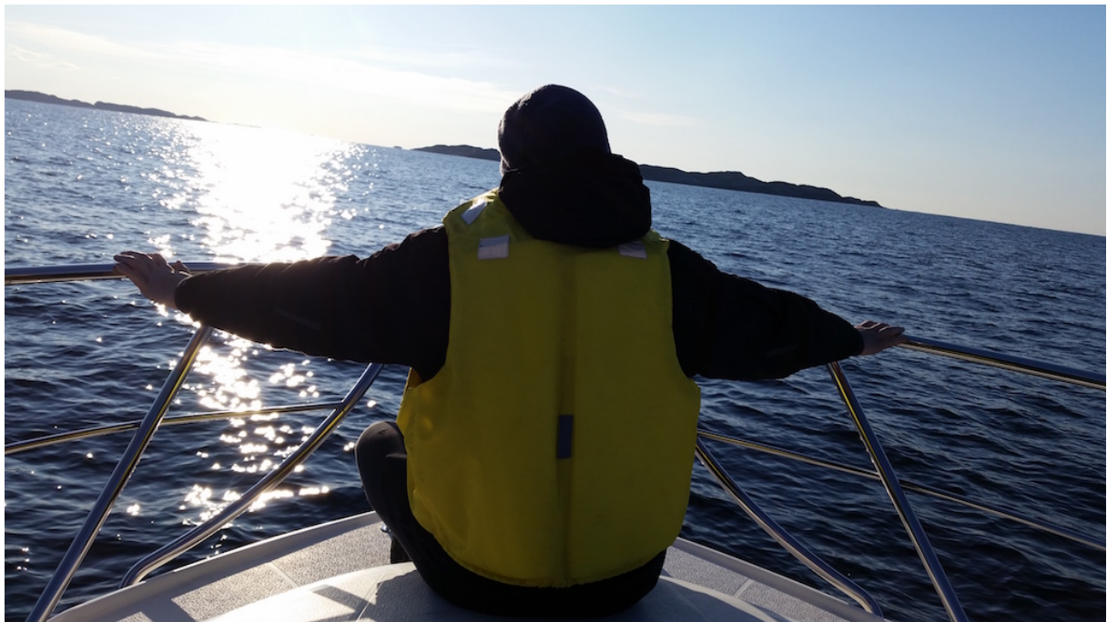
Båttur utenfor Algerøy i nydelig vær