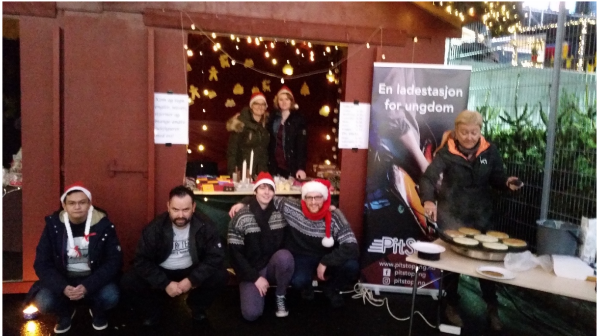
I fjor solgte vi for 20.000 på julemarkedet 😊 ( Egenproduserte varer )