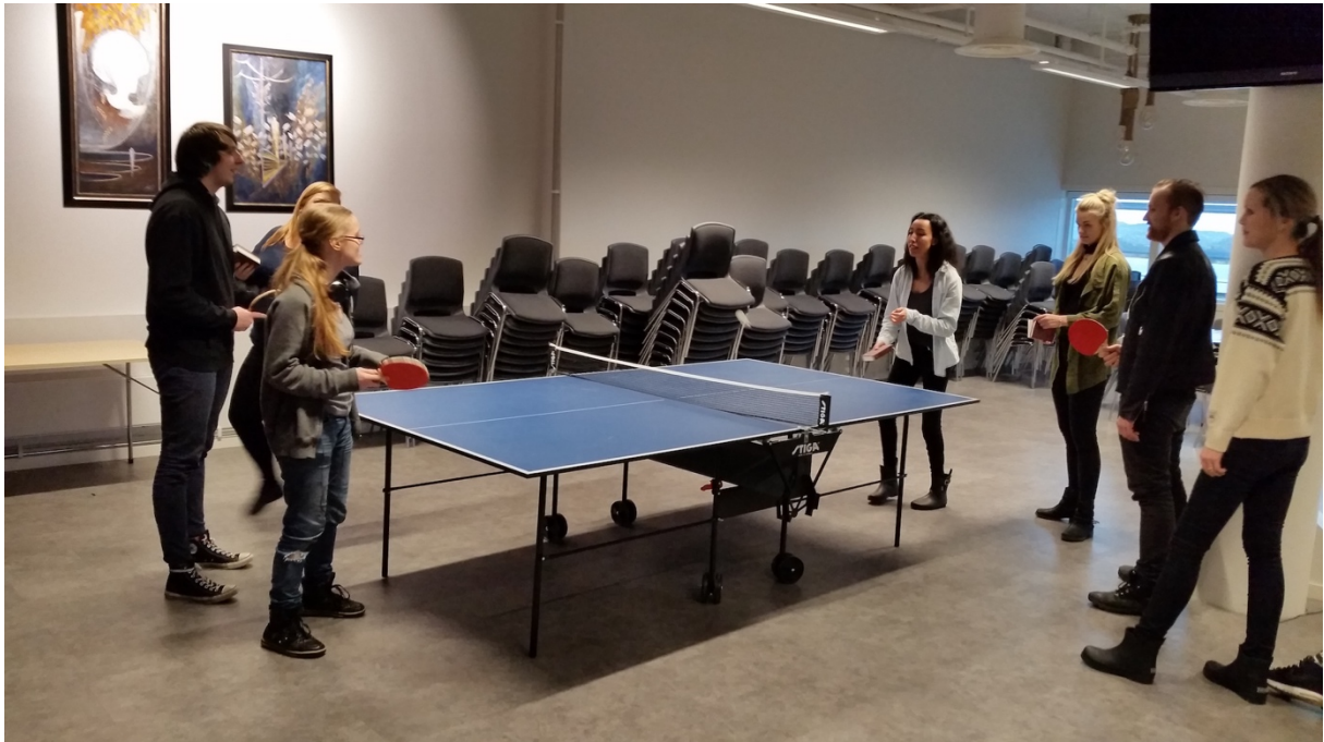
Bordtennis hører med hver dag 😊