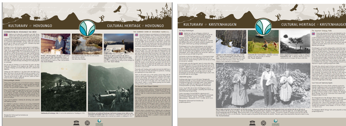
Kulturtavlene. Kopi frå søknad

Planlagt utforming av tavlene; Mål A2 42 x 59,4 cm eller 50 x 70 cm. Materiale – utskiftbar skiltplate i aluminium eller akryl med trykk og pulverlakkerte aluminiumsstolpar. Skilta skal monterast med fjellfot. Høgda på skilta er 100-150 cm for skråstilte skilt.