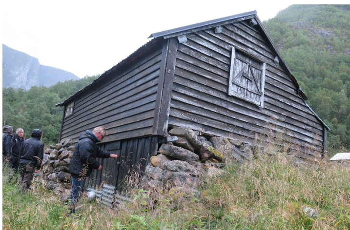
Bilde viser murane på nedsida av stølshuset.

Den samla belastninga på økosystemet skal vurderast ved søknad om tiltak jf. nml. § 10. Tiltaket vil i liten grad føra til nye inngrep i landskapet. Dreneringsgrøfta vil i liten grad gje endringar på landskapet. Frå gamalt av vart torv til takteking henta frå nærområdet. Dette vil gje eit lite inngrep i landskapet og vil lite truleg føra til belastning på økosystemet i området. Forvaltar vurderer den samla belastninga av tiltaket som liten.