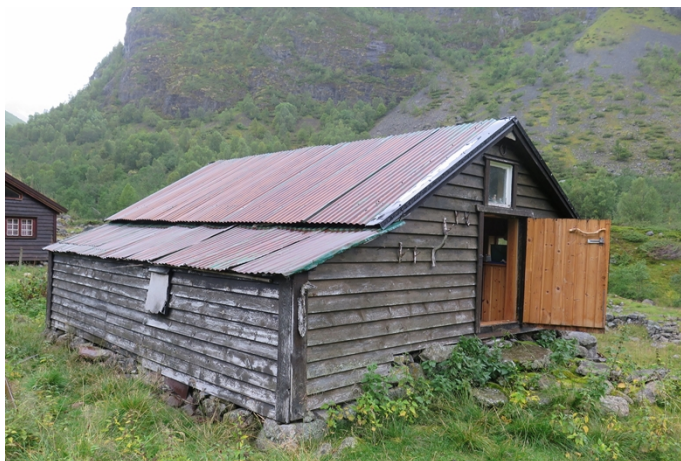
Oversida av stølshuset.

Tiltakshavar har plikt til å vise varsemnd og til straks å melde frå til Sogn og Fjordane fylkeskommune ved kulturavdelinga dersom det under arbeid vert støytt på automatisk freda kulturminne jf. lov om kulturminne § 8 2. ledd.