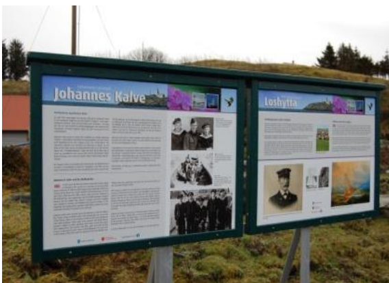
Formidling av kulturminne på Kalve.