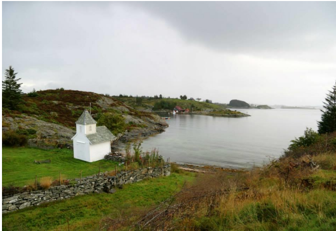
Kolerakyrkjegarden på Kalve.