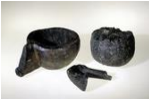
Funn frå heilagstaden på Eidsbøen