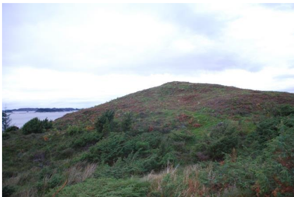
Gravminne frå bronsealder ved Selbjørn bru