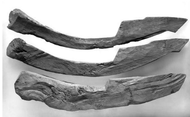
Båtstamnar frå funn i myr på Haukanes