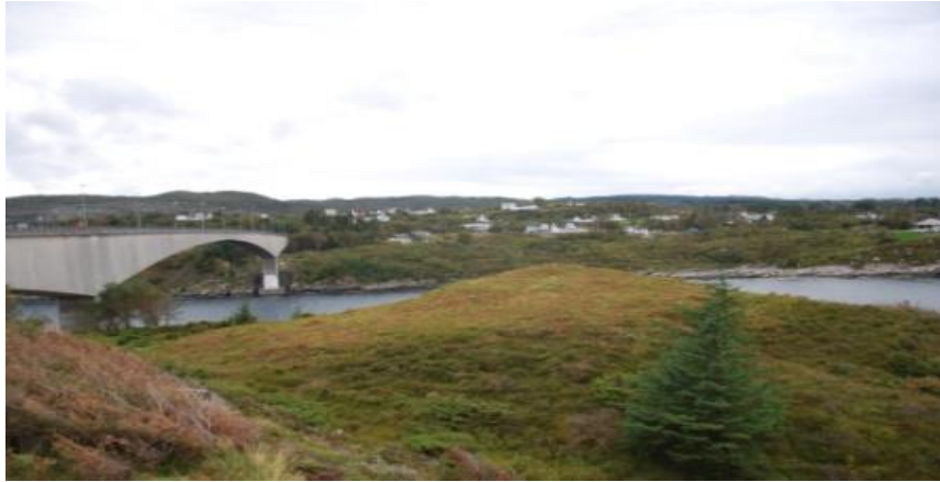
Gravhaug fra bronsealder ved Selbjørn bru.