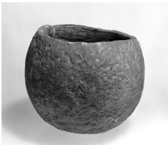
Bolle frå Valhammar