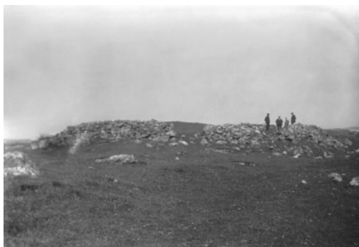
Restar av bygdeborg på Møgster