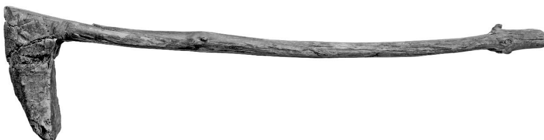
Grev frå Veivågen