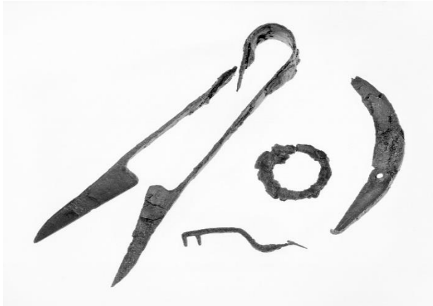
Kvinnereidskap frå Taranger