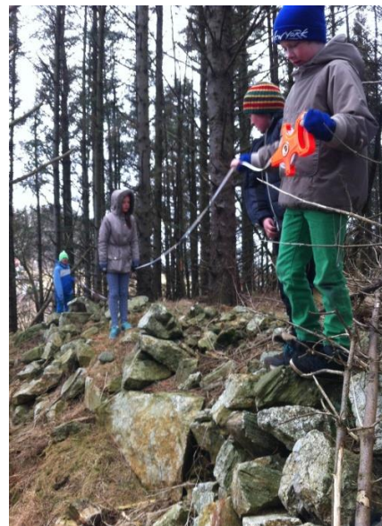
Måling av bygdeborgen på Møkster. Elevprosjekt på Møkster skule hausten 2015.