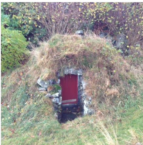
Potetkjellar/Jordkjellar på Gardsbruk Haugen i Torangsvåg.