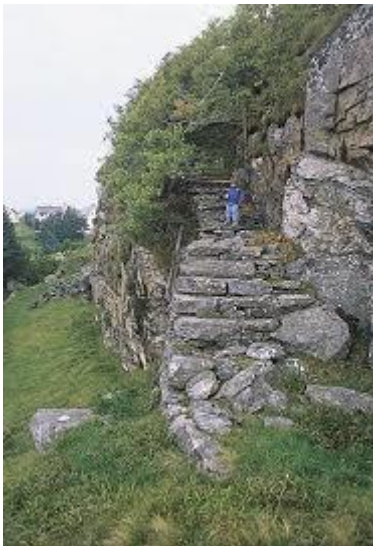
Skipmannsstegen ved loshytta på Kalve

I 1849 bryt det ut ein kolera epidemi under sørafisket etter sild. Eit av minna etter denne grufulle hendinga finn me på Kalve. Framleis går den under nemninga «kolerakyrkjegarden» på Store Kalsøy. 1800-talet er tida det blei etablert skulestover, postopneri og ein fekk rutebåtar som frakta gods og folk sør og nord for øyane. Ein får nye kyrkjer på Storebø og Stolmen. På Kalve spring smågutane frå 1890 opp «skipmannstegen» til loshytta for å speide etter fartøy som kunne ha bruk for los. Fram mot 1900-talet utvikla fiskeriet seg med at ein prøver seg på nye fiskefelt, – Islandsfiske. Det vert og tatt i bruk nye typar reiskap. I 1894 deltok ein seglkutter frå Møkster truleg som første Austevolls båt på makrelldorgefisket i Nordsjøen. I 1903 prøvar ein ut den nota som skulle bli viktig for 1900 og 2000 talet sitt havbaserte industrielle fiskeri. Frå skepsis til ei nyvinning frå Amerika snur trua, og etter kvart vart snurpenota ein faktor for suksess og vidareutvikling i Austevoll.