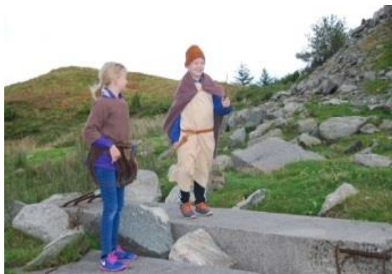
Ein skuledag i bronsealder