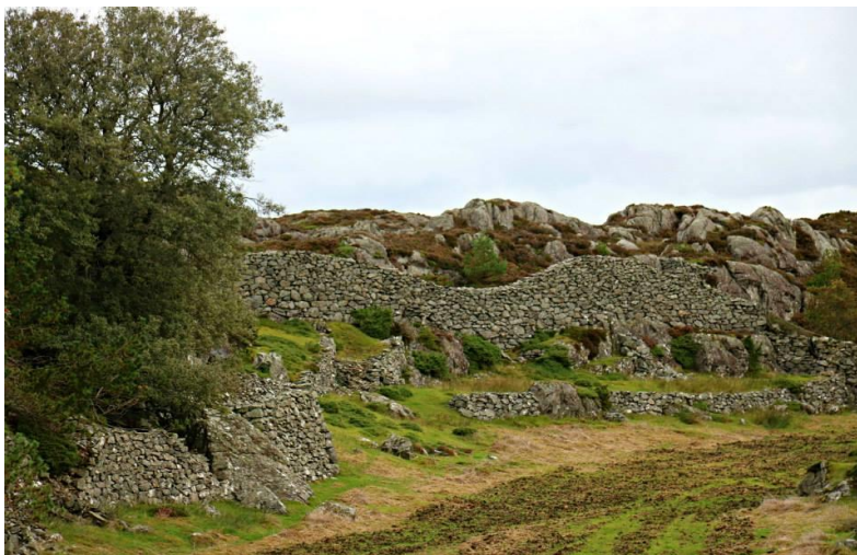
Samson sine murar på Stolmen. Ein verdi for framtida?