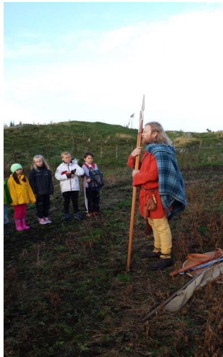
Ein skuledag i jernalder ved Aratuå/Grønestølen på Hufthamar