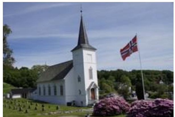
Austevoll kyrkje. Eit av fleire signalbygg i kommunen?