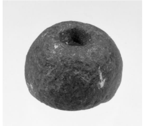
Spinneshjul frå Vik