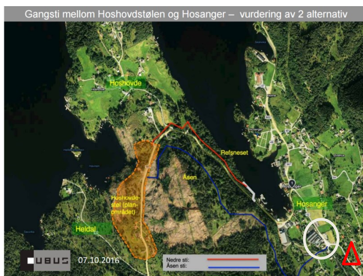
Figur 2 Gangstialternativ

Tiltakshaver har teke utgangspunkt i gangsti til den største bedrifta i Hosanger og til skulen. Bedrifta er vist med kvit ring i bilete til høgre. Den private skulen ligg utanfor bilete langs den vegen ved den raude trekanten.