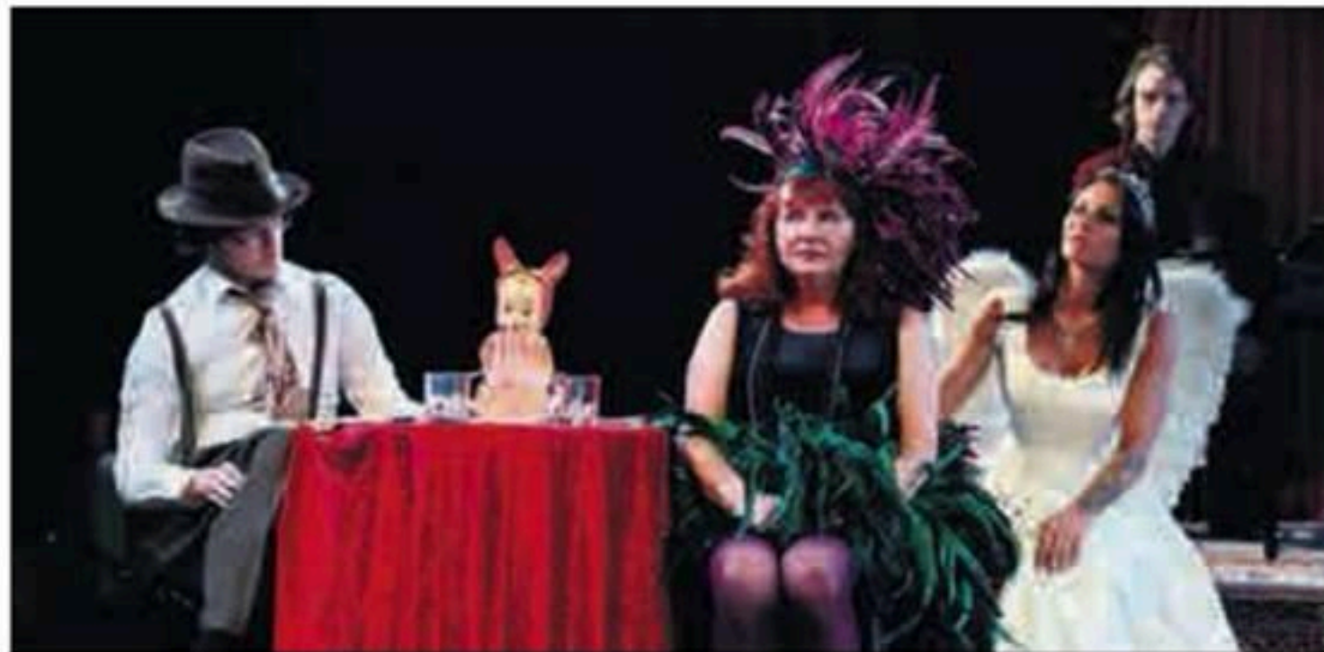
LEVD LIV PÅ SCENEN: Vanlige folks drømmer, lengsler og skuffelser er blitt til forestillingen «Det var en gang et menneske», som har hatt flere ekstraforestillinger under Festspillene i Bergen.