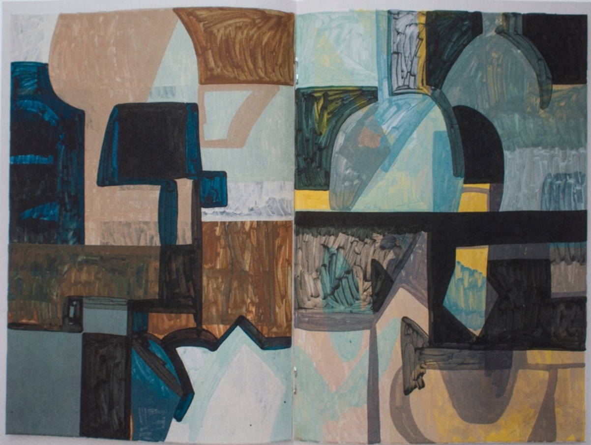
Nytt landskap (2016)