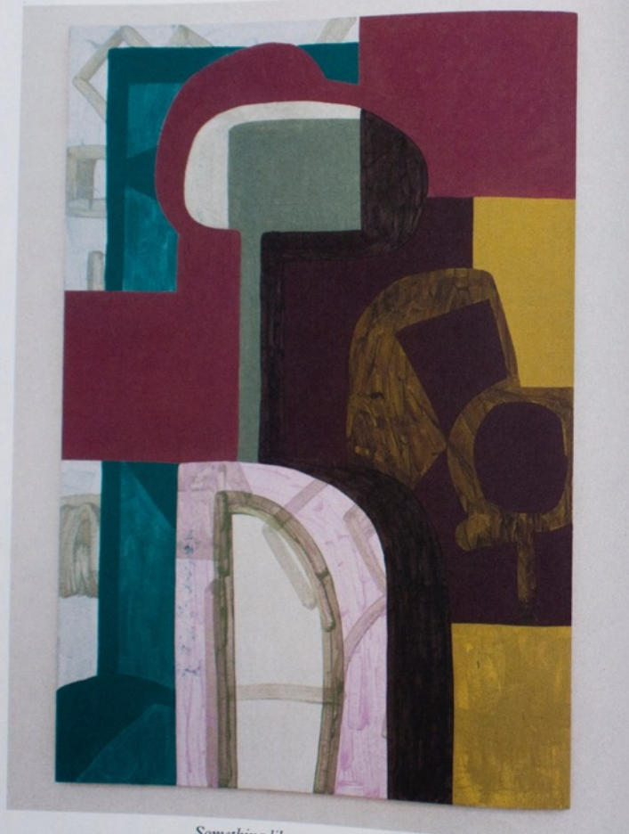
Something like a panoptikon (2016)