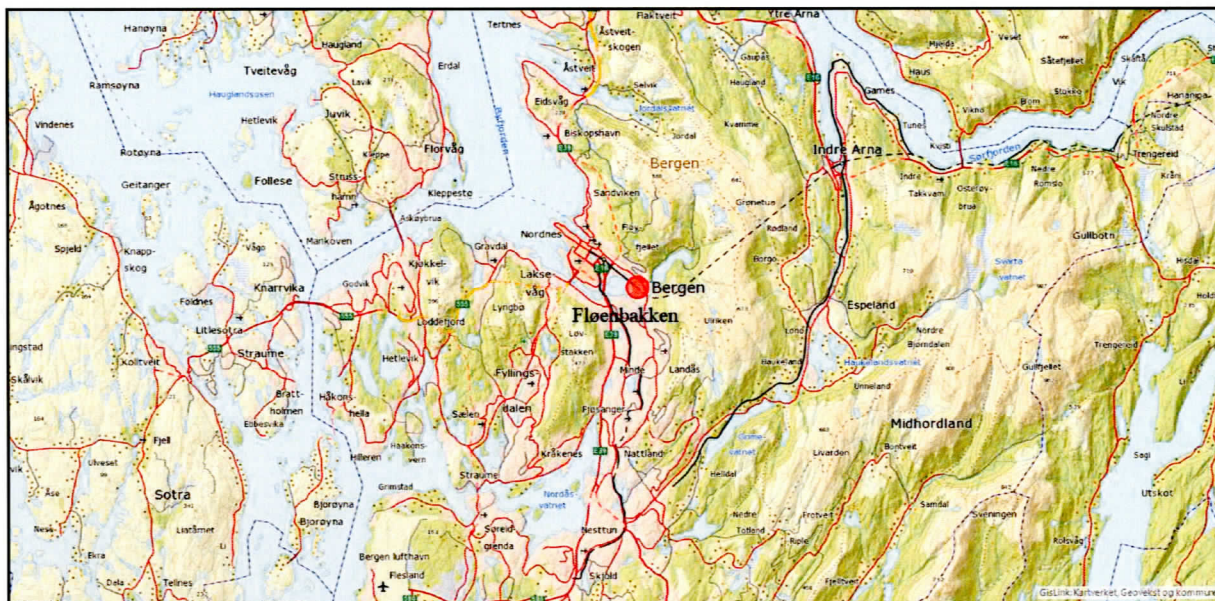
Figur 1. Planområdet med den omsøkte kulturminnelokalitet ligger ved Fløen i bunnen av Store Lundegårdsvannet. Grafikk S. Diinhoff.

Søknad om dispensasjon fra kulturminneloven § 8.4 ble sendt fra Hordaland fylkeskommune datert den 17.2.2017 til Riksantikvaren med kopi til Universitetsmuseet i Bergen på vegne av tiltakshaver Bergen kommune.