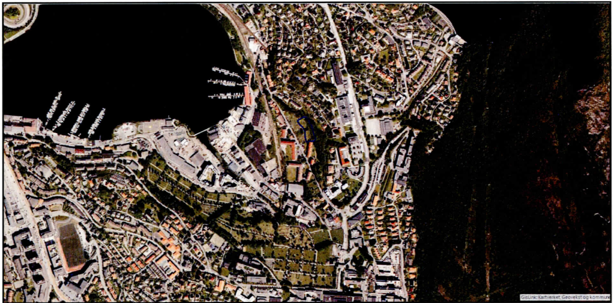
Figur 2. Satellittfoto av området rundt den omsøkte lokalitet. Lokaliteten ID 224929 er her avsatt med blå linje. Det bemerkes hvor tett bebyggelsen er i området rundt.