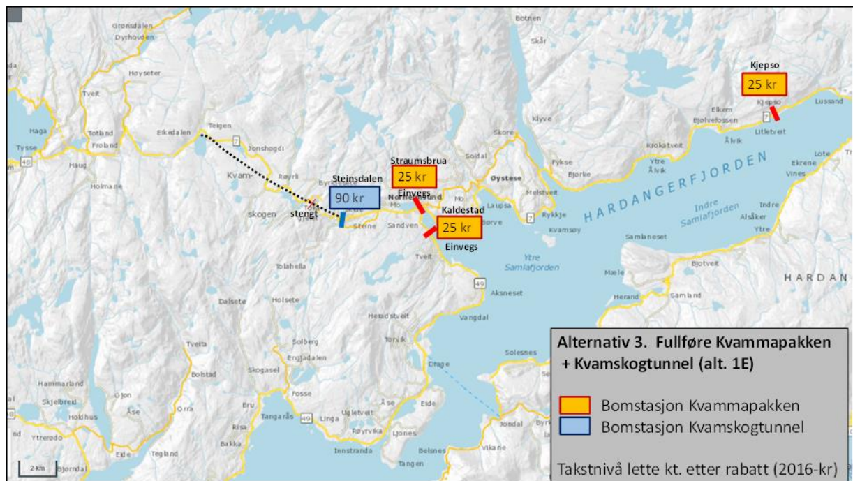
Figur 4. Prinsipp bompengesystem og aktuelt takstnivå – alternativ 3.

Bompengesystemet og takstnivå på lokale bomstasjoner for fullføring av Kvammapakken som i alt. 2.