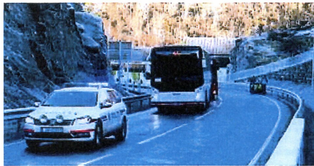
Frå opninga av Borgatunnelen 2011.

Osterøybrua vart opna i oktober 1997 og deretter følgde Tirsåstunnelen (1998), Hannisdalslina (2002) og til slutt ny FV 567 Hauge – Lonevåg i november 2011.