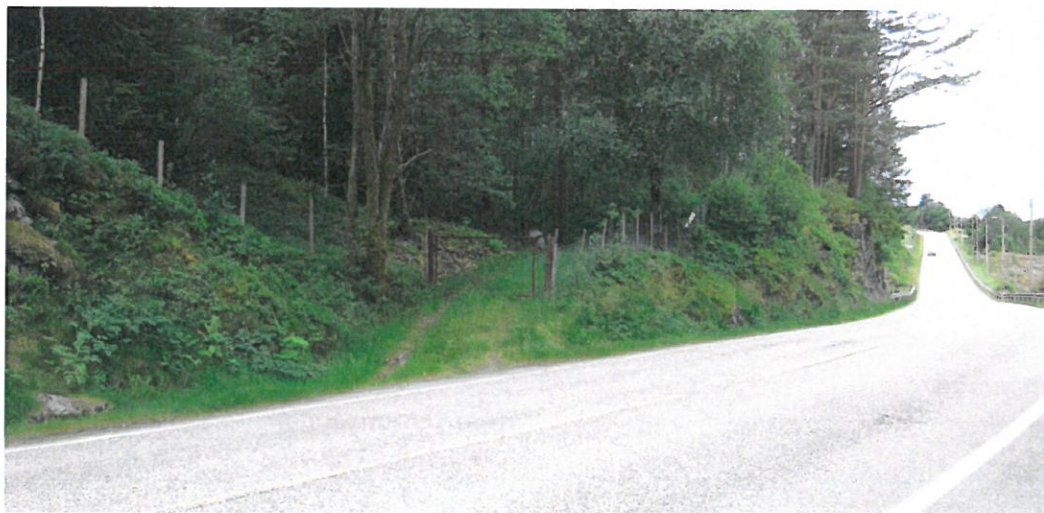
Dagens parkering ved «Sjøvegen»: Foto frå synfaring 29.07.2016.

Statens vegvesen har ikkje vurdert denne avkøyrslar konkret, men legg til grunn at det vil vere dei same strenge vurderingane for å etablere ei avkøyrslar her, med omsyn på mellom anna haldnings- og funksjonsklasse og fart.