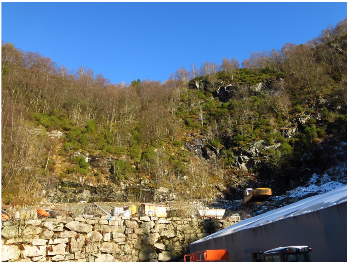
Bilde 2. De sørøstlige deler av planområdet, se punkt 2 i figur 2 i notatet. Her er det etablert en skredvoll.