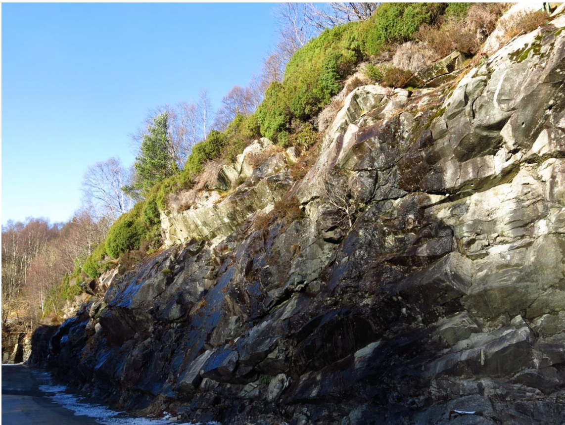
Bilde 4. Bergskrenter øst for planområdet. Mindre deler av berget er sikret med bolter, men det gjenstår en del sikringsarbeid for å oppnå tilstrekkelig sikkerhet med hensyn på steinsprang.