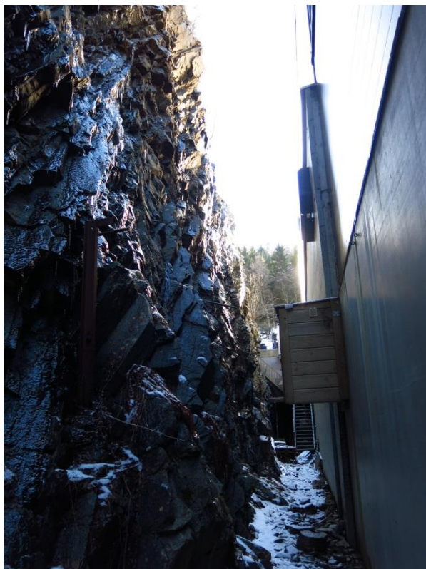
Bilde 1. De sørlige deler av planområdet, se punkt 1 i figur 2 i notatet.