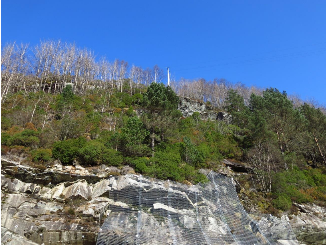
Bilde 3. Steil bergskråning øst for planområdet, se punkt 3 i figur 2 i notatet. Deler av berget er sikret med bolter og steinsprangnett.