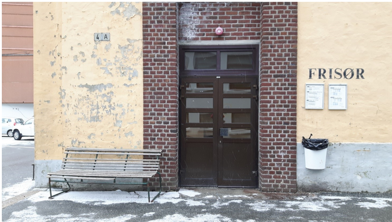
Figur 2 Venterommet til buss er berre tilgjengeleg i frisøren si opningstid

tilfredsstillande for trafikktryggleik. Dette kan med føremon også vurderast med omsyn på kollektivterminalen på Dale, som har lav standard utan klimavern. Bussane må også snirkle seg gjennom sentrum for å kome til. Ei ombygging av skulen på Dale er under planlegging, og dette bør vere ein anledning til å løyse trygg av/påstiging for skuleelevar, og vurdere ny «bussterminal».