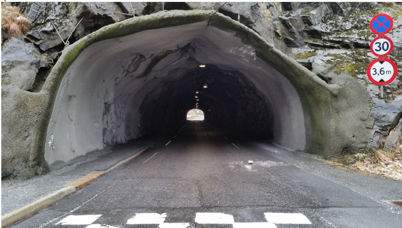
Figur 2 Fv 314 Kvamstotunnelen i Dale sentrum

Som gang/sykel-tunnel kan ein forventa at det vert utført tiltak som vernar om mjuke trafikkantar. Tiltak kan vera: ny og betre belysning og opparbeiding av eit betre og meir tenleg fortau og sikring med høgare (avvisande) fortauskant. Kvitmaling av tunnelveggar er også eit vanleg brukt tiltak for å betre lysforhold.