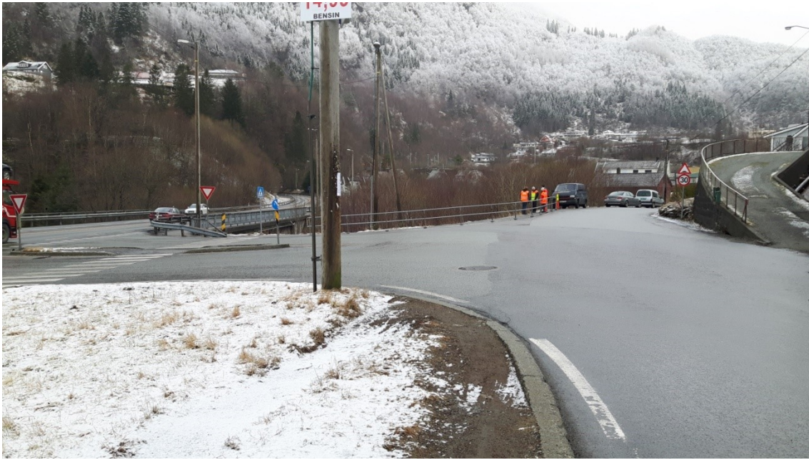
Figur 1 Fv 343 i Vaksdal, Duesvingen

Den 7. mars 2017 var kommunen på synfaring i lag med Statens vegvesen, og me identifiserte følgjande problem: