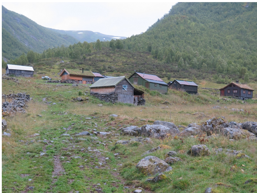
Stølen Hjølmo.