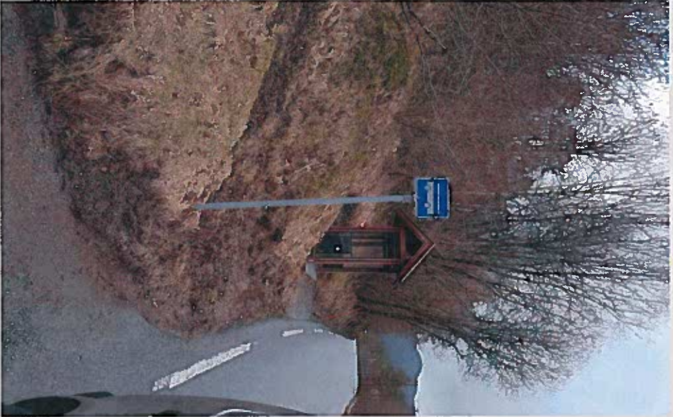
Stolper og busstopp Asen