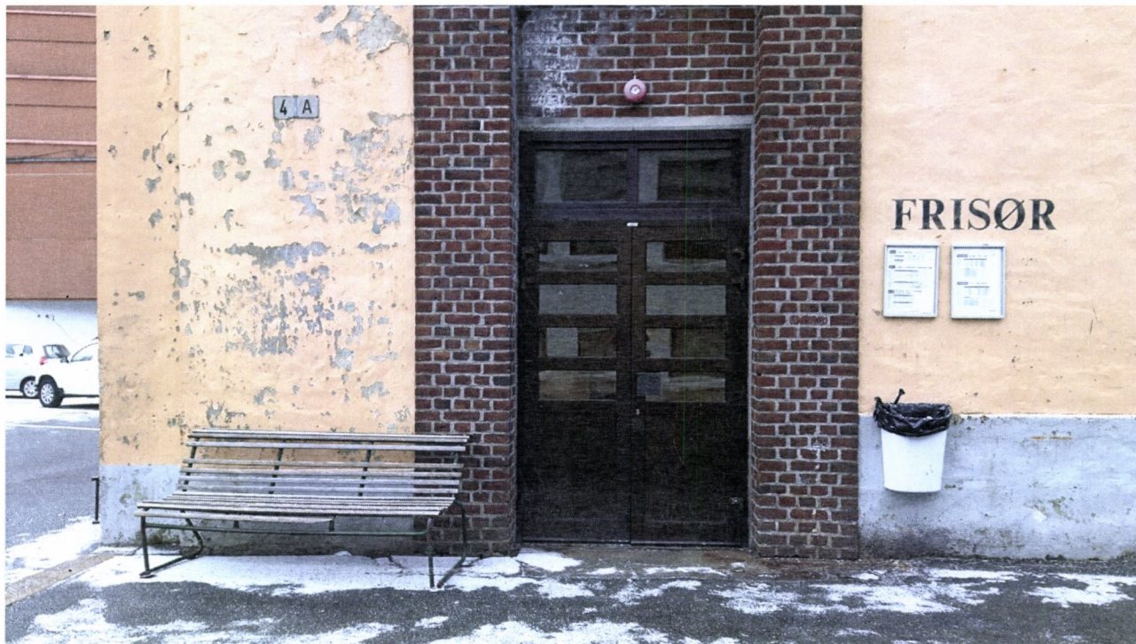
Figur 2 Venterommet til buss er berre tilgjengeleg i frisøren si opningstid

Fokusområde vil vere trygg skuleveg og nærmiljø, hjartesone for skulen, betre forhold for gåande og syklende. Dette vil også inkludere vurdering av av- og påstigning for skuleskyss, som i dag er lite tilfredsstillande for trafikktryggleik. Dette kan med føremon også vurderast med omsyn på kollektivterminalen på Dale, som har lav standard utan klimavern. Bussane må også snirkle seg gjennom sentrum for å kome til. Ei ombygging av skulen på Dale er under planlegging, og dette bør vere ein anledning til å løyse trygg av/påstiging for skuleelevar, og vurdere ny «bussterminal».