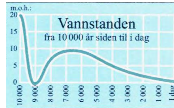
Diagram som viser endringar i havnivå på Fedje, og lokaliteten plassert på eit kart med havnivå som i slutten av eldre steinalder