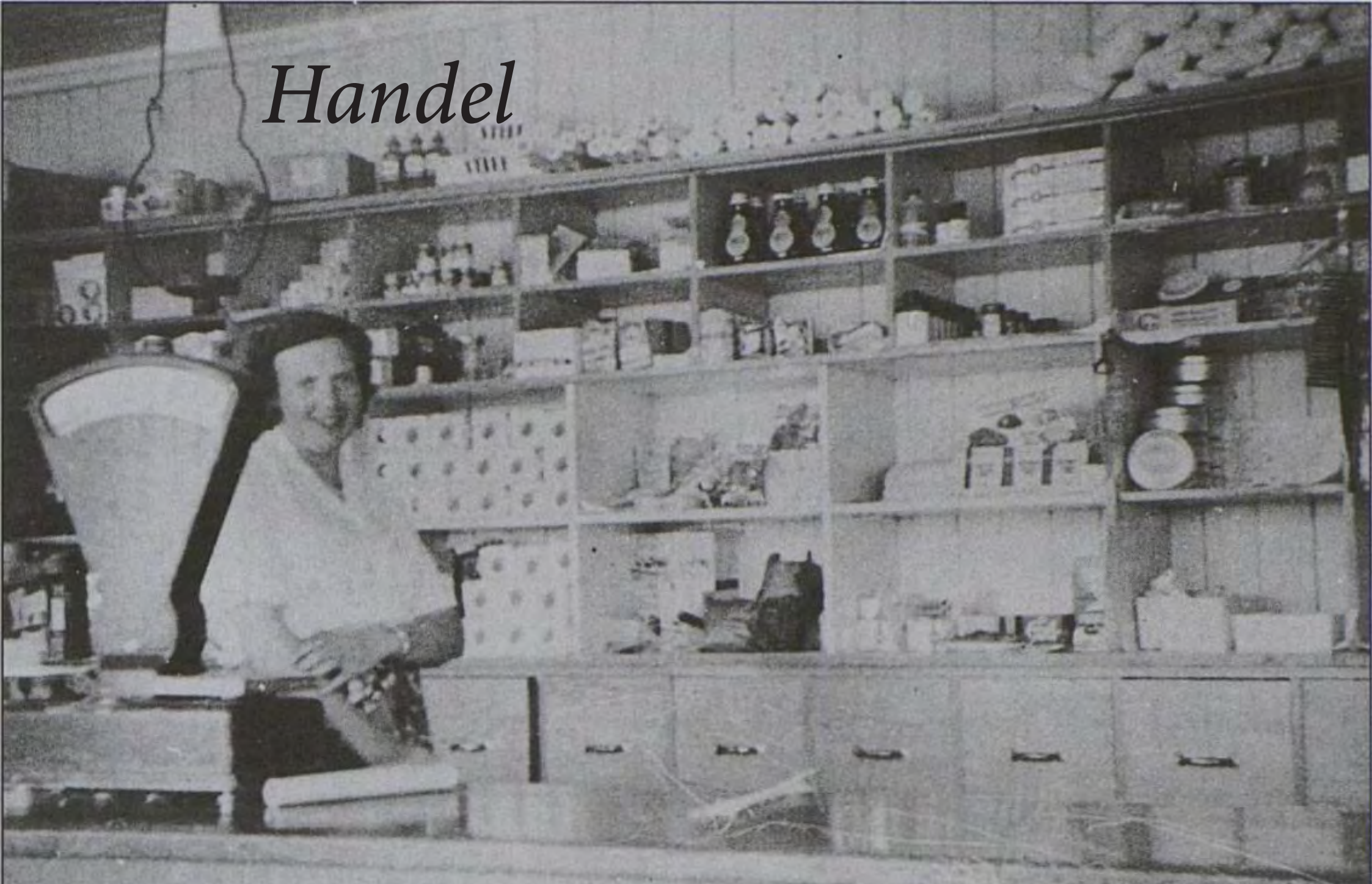
Interiør i butikken på Stormark (Skogseth 1996: 510)