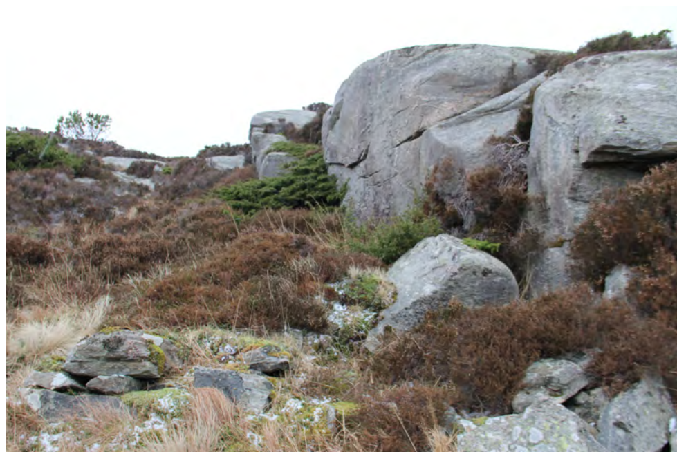
Her sto stølshuset til Vågane. Dette er det einaste kulturminnet knytt til gardsdrift i utmark som er registrert og attfunne (mest truleg same som G 5, 1265 104 2)