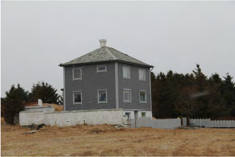
Stilrein bustad gbnr.172/194. Bygd i 1938. I 1946-1954 var eigaren fyrbetjent på Hellesøy fyr.