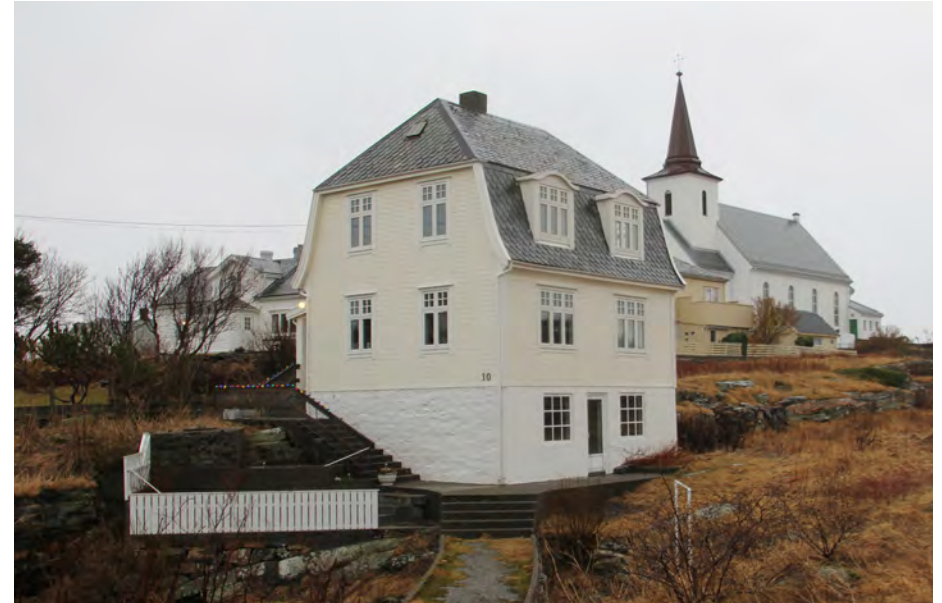
Fedje har flott arkitektur frå mellomkrigstida, gjerne yrkesfiskarane sine bustadhus. Gbnr.168/65 bygd i 1935 (oppe) og gbnr. 168/55 bygd i 1934, nede. Desse er ikkje i SEFRAK-registret.

Fedje har ei sær sars god gardssoge i Skogseth 1997, med uvanleg merksemd på byggeår på bygningane på dei einskilde bruka. Dette er opplysningar han har fått direkte av eigar sidan dei ikkje finst i matrikkelen.