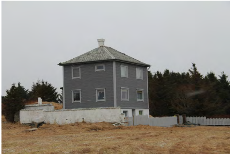
Stilrein bustad gbnr.172/194. Bygd i 1938. I 1946-1954 var eigaren fyrbetjent på Hellesøy fyr.