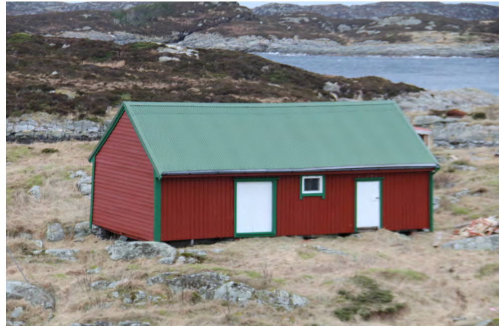
Løe med flor på Hesteneset. Dette er det eldste bygget knytt til gardsdrift på Fedje (G 28).

- Ei løe er datert 1900-1925, 10 til 1800-1899, 14 til 1875-1899, 2 til 1850-1874 og 1 til 1825-1849.