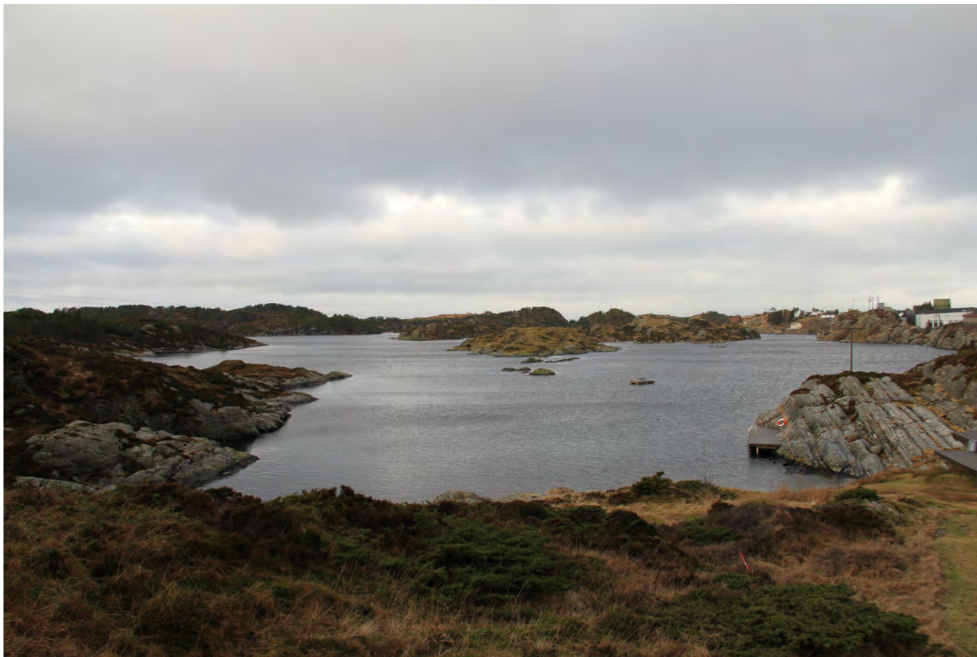
Måsholmen i Husavatnet, sett frå aust.

Flintdolken skal vere funnen på Fedje, moglegvis på holmen i Husavatnet. Det er uråd å vite sikkert kvar dolken faktisk vart funnen. Men Måsholmen var nok ein god stad sist i steinalderen, midt i det som var ein lagune med opning til havet både i vest og aust. Like sør for Husavatnet, ved Grønevasstjørna vissr pollenbotaniske granskingar ei markant auke i bruk av brann og ei opning av vegetasjonen frå omlag 2000 f.Kr. (Brekke & Skaar 1995). Til saman er dette gode indikasjonar på at folk hadde slege seg til her med beitedyr, truleg sau, kring 2000 f.Kr. Flintdolken viser at dei låg godt til rette i kystleia og hadde midlar til å skaffe seg prestigevarer frå Danmark. Berre 12 dolkar av denne typen er funne på vestlandet sør for Stadt (Zinsli 2007). Ein reknar med at dolkanane vart lagde i jorda, i små tjørn eller ved bergnabbar, som offergåve til gudane.