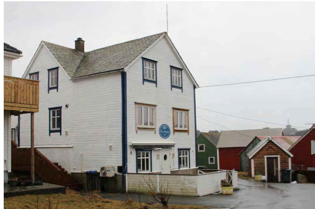
Gbnr. 168/42 Soberg. Huset bygd 1924 eller like etter. Daglegvareforretning i underetasjen frå starten til 1986 (?) (Skogseth 1996: 218).