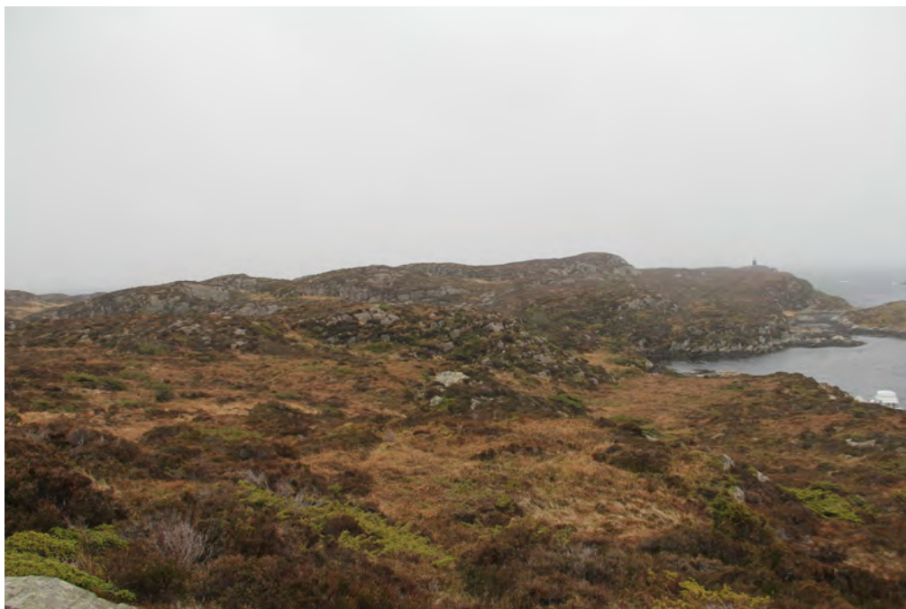
Flinten vart plukka opp kring høgdedraget midt i bildet.

På og kring ein sauesti på gbnr. 168/30 på nordsida av Sildevågen, vart det i 1971 plukka opp kring 80 flekker og avslag av flint. Nærare arkeologiske granskingar med prøvestikk var utan resultat. Lokaliteten ligg i dag som ASK 97125 i Askeladden, definert som busetjing-aktivitetsområde frå steinalder (automatisk freda). Funna som vart gjort finst på Universitetsmuseet i Bergen som B 12593. Ingen av funna er diagnostiske, altså at dei definerer ei snevrare dateringsramme. Fem av funna er flekker, det vil seie kontrollerte avlange avspaltningar brukte til reiskap av ulikt slag. Flekkene og fleire av avslaga (dei mindre kontrollerte avspaltningane) er retusjerte, det vil seie at dei er intensjonelt tildanna vidare til bruk som reiskap (til dømes kniv eller skrapar). Funna vart gjort i eit område som ligg mellom 11 og 15 meter over havet i dag.