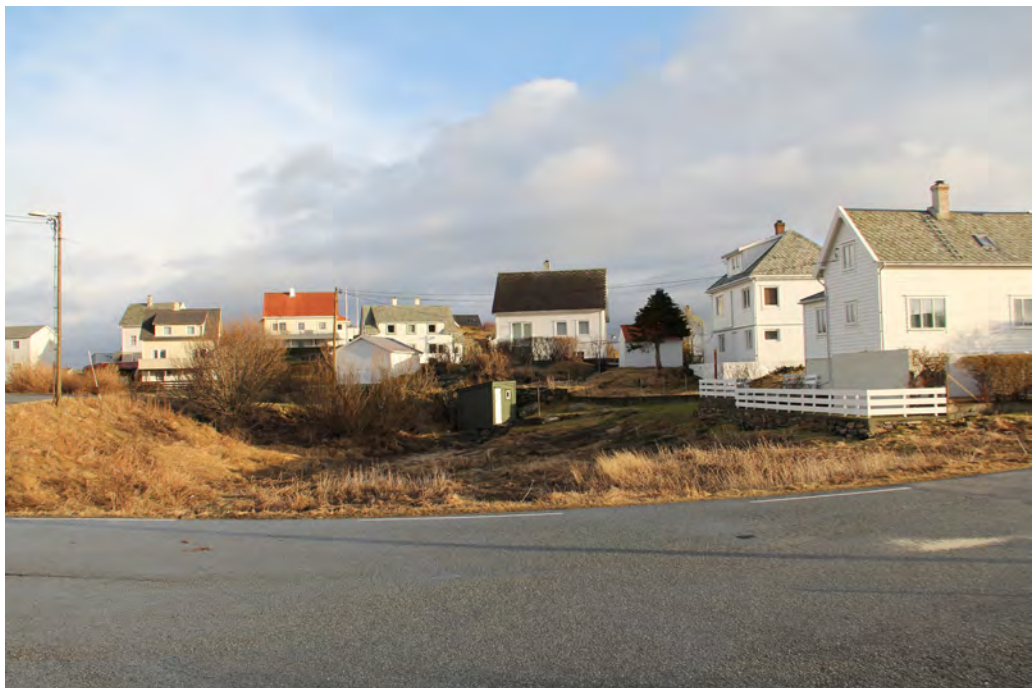
Lokaliteten ASK 111944 aust-søraust for Fedje kyrkje.

Ein annan stad er funnstaden definert til Moldøyna, utan at ein kan feste særleg lit til dette. Ei datering til mellomalder (1050-1537 e.Kr.) er det mest sannsynlege. Funnet vert lagra ved Oldsaksamlingen i Oslo. Det er ingen hefte knytt til funnstaden.