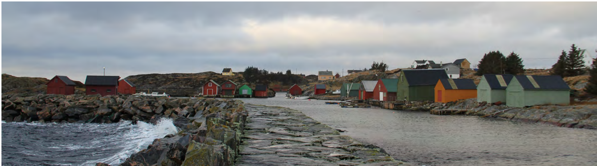
Naustmiljø bak Æskjeret, Storemark.