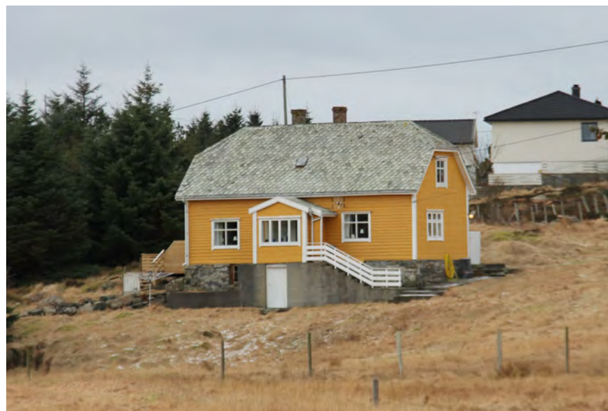
SEFRAK 101 22 i Langedalen frå 1825-1849.