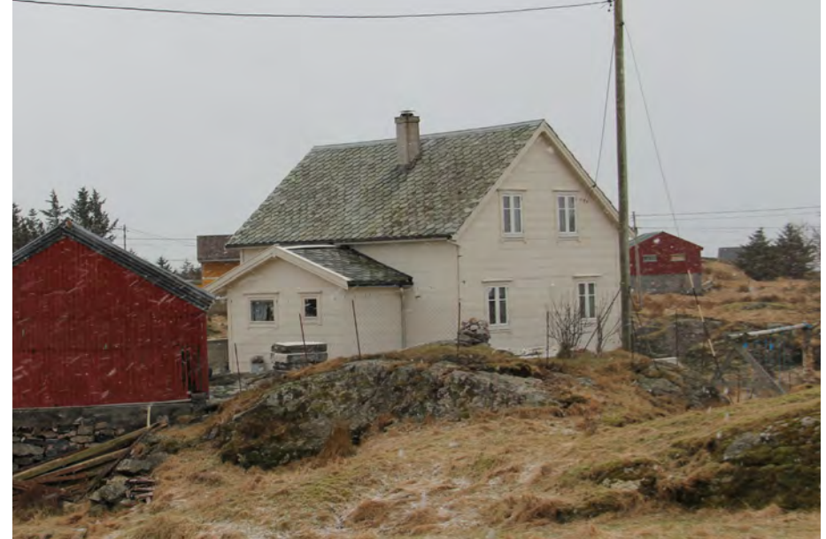
SEFRAK 104 18 på Nyheim, Storemark frå 1850-1899.