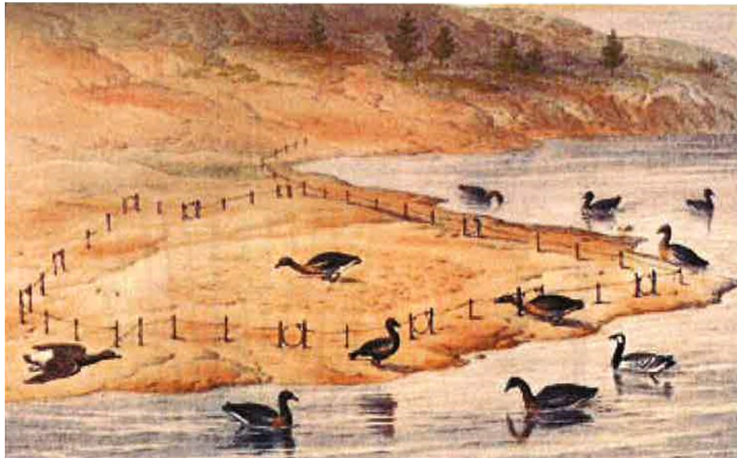
Gåsefangst med snarer på låge landtunger ved vatn i svensk Lappland (Lloyd 1867, Sylvester 2012).

Lokaliteten har uavklart vernestatus i Askeladden, som tyder at han bør reknast som automatisk freda til vidare.