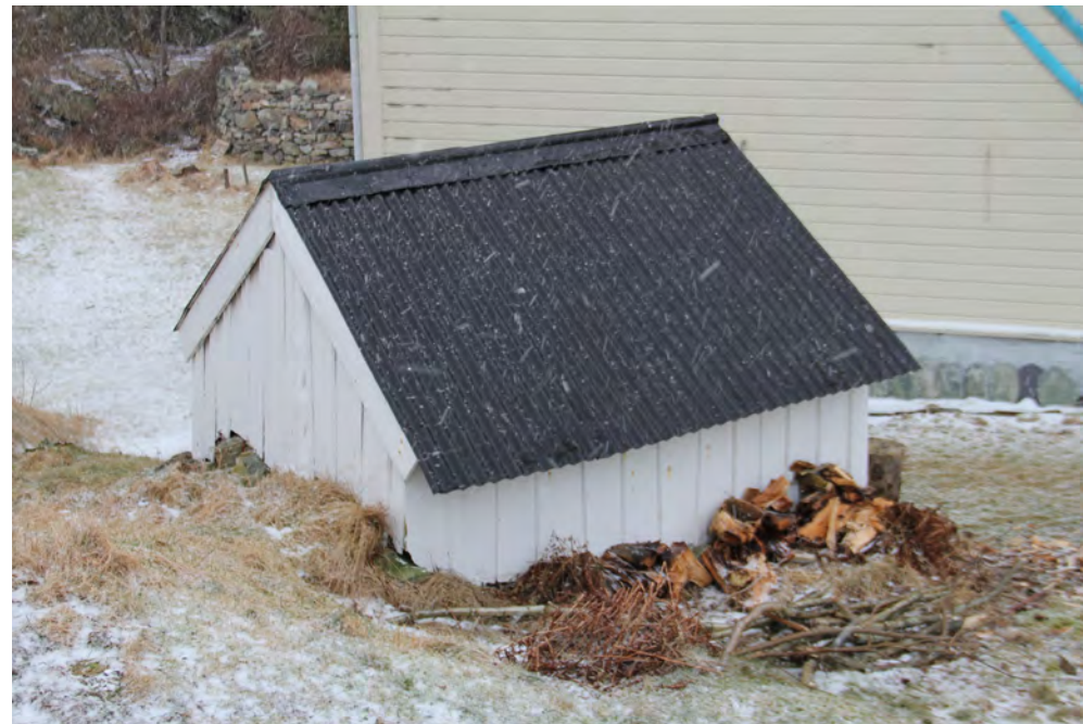
A2, eldhus i Rognsvåg gbnr.167/2.