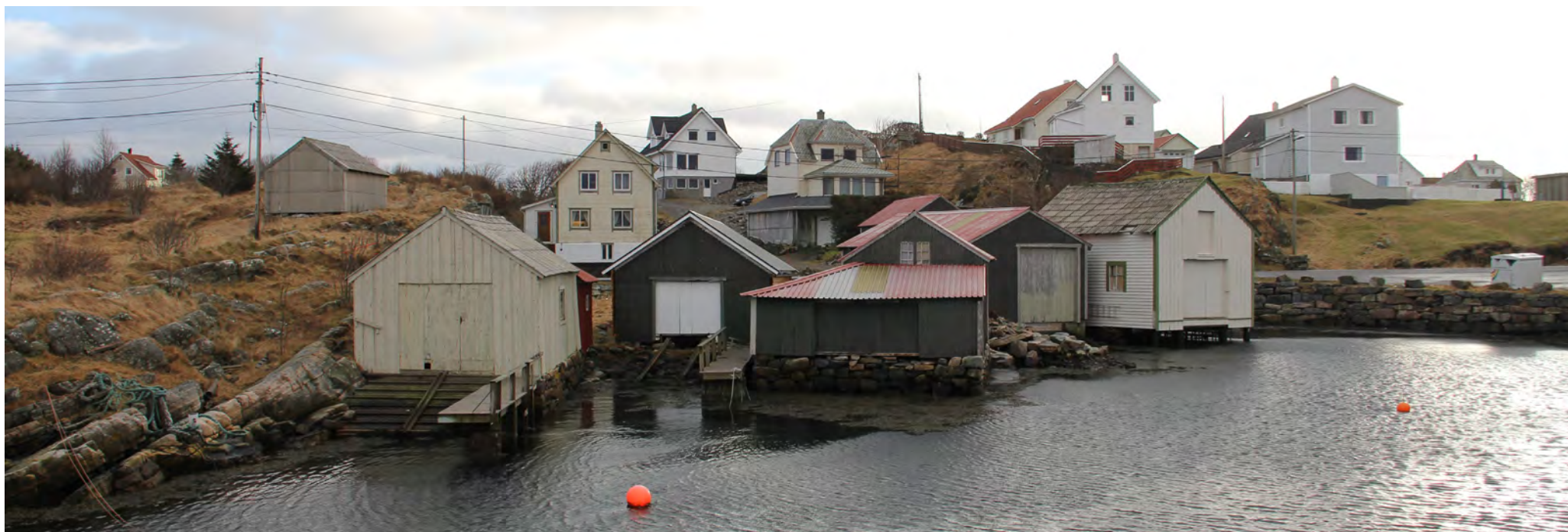
Naustmiljø i Stubergsfjæra i Kyrkjevågen.