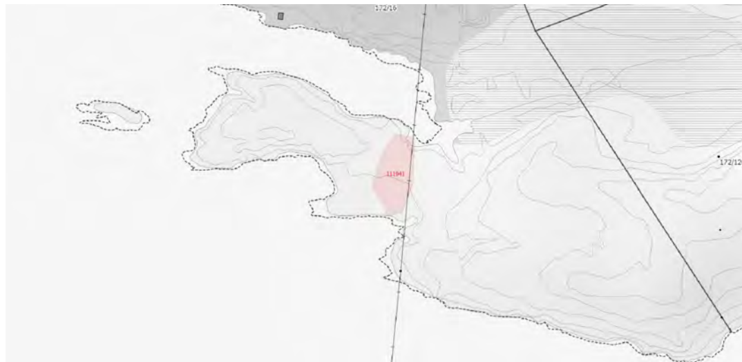
ASK 111941, funnstad for myrpinningar, ved rota av Vadneset i Storevatnet.