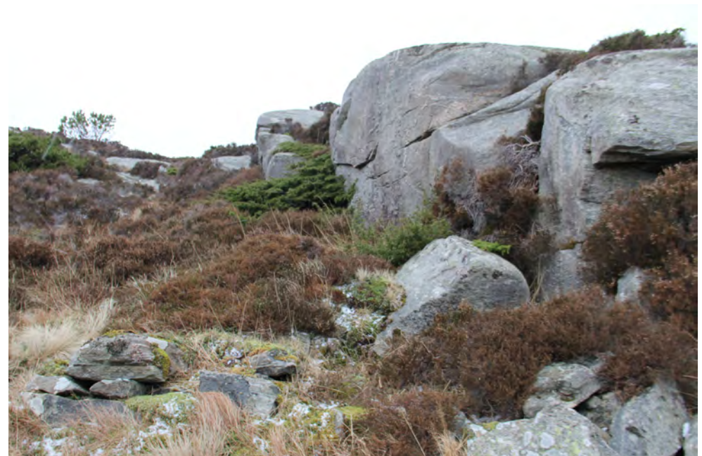
Her sto stølshuset til Vågane. Dette er det einaste kulturminnet knytt til gardsdrift i utmark som er registrert og attfunne (mest truleg same som G 5, 1265 104 2)