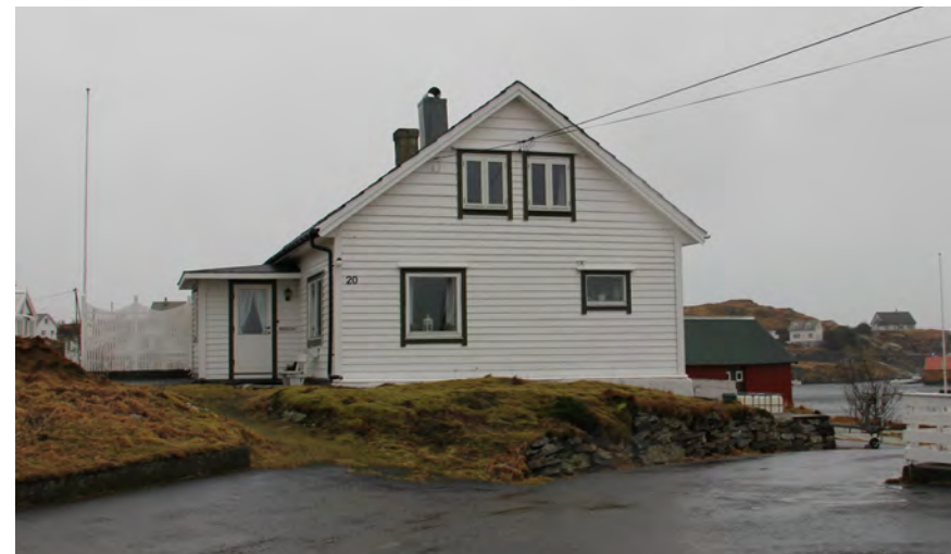
Med unntak av Kremmarholmen er SEFRAK 102 26 det eldste bustadhus som er registrert. Noko endra på, men dersom alderen verkeleg stemmer har huset høg verdi.