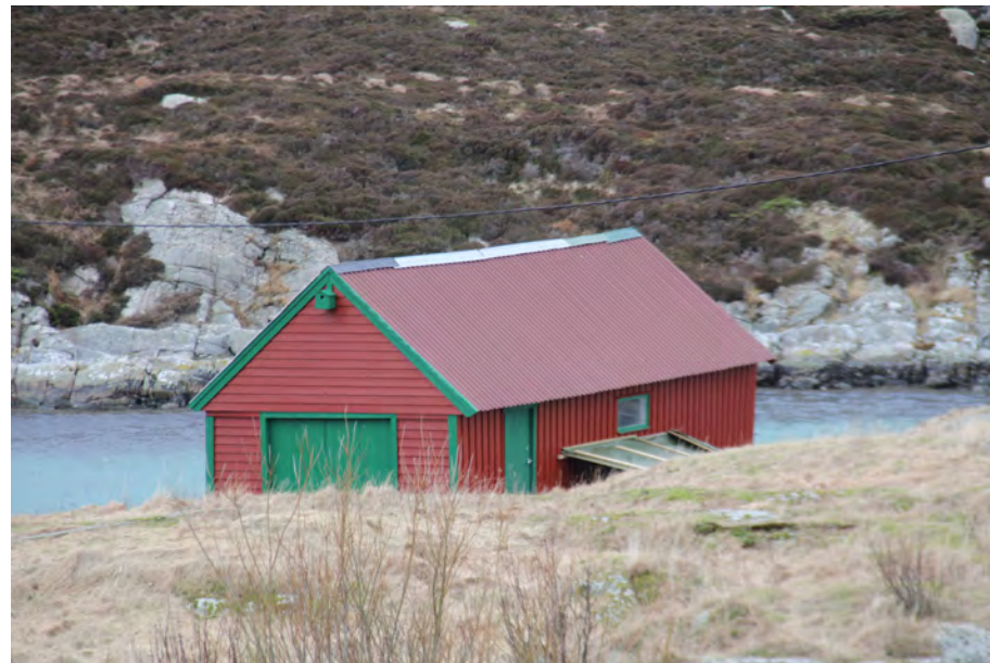
S1, naust på Hesteneset frå 1825-49 (Sefrak 101 12)

Det er registrert (SEFRAK) til saman 47 objekt i kategorien naust/sjøbu. 6 av desse er grunnmurar eller ruinar. Det eldste objektet er A7 på Kremmarholmen (101 24) frå 1700-talet. Vidare er 3 objekt datert til 1825-1849, to av dei på Kremmarholmen, det tredje på Hesteneset. 2 objekt, begge ruinar ved Fyrsundet, er tidfest til 1850-1899. 22 objekt er tidfest til 1875-1899, og 15 til 1800-1899 generelt. Endeleg inneheld SEFRAK 4 objekt frå 1900-1924.