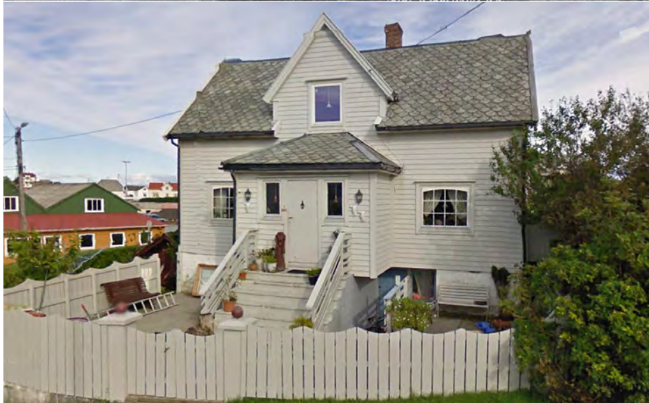
Gbnr. 168/47 Tuften. Bygd kring 1933. Kafedrift og overnattingsverksemd. Foto frå før krigen (Øvst) (Skogseth 1997: 219)