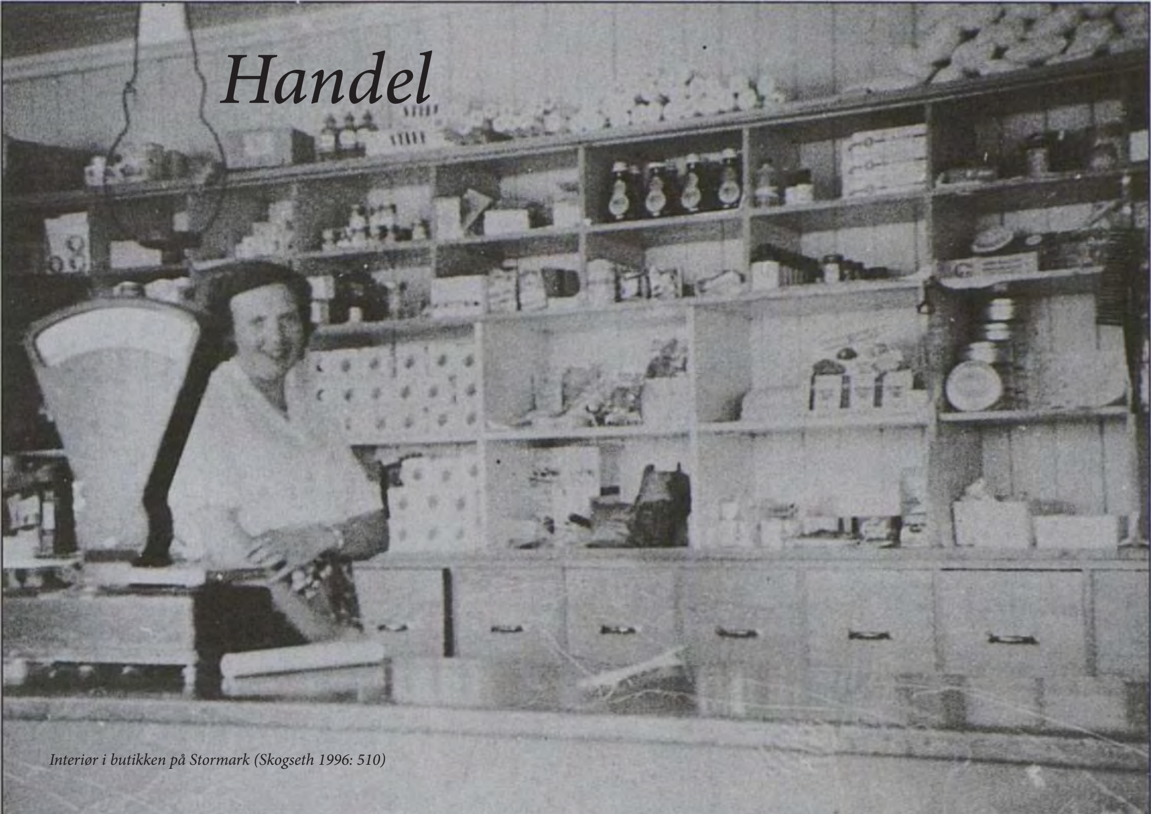
Interiør i butikken på Stormark (Skogseth 1996: 510)