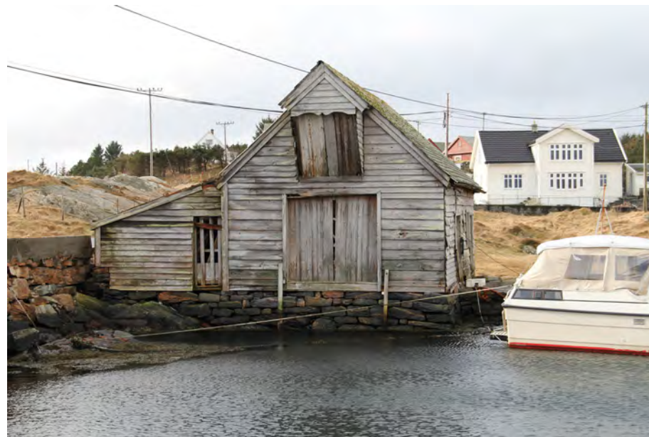
S4, Kahrsnaustet frå 1825-49 (Sefrak 101 19), med utstikk for vindespel.