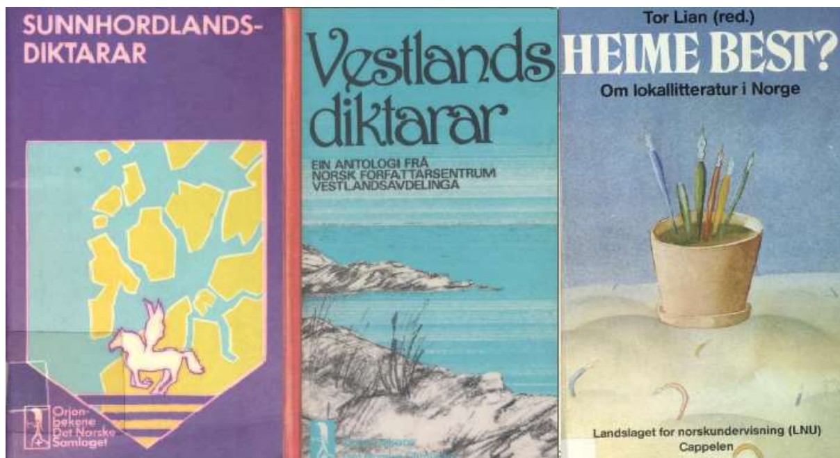
Omslaga til tre klassikarar i norsk regional litteraturhistorie..

Det litterære landskapet i fylket har vore prega av eit sterkt litterært miljø i Bergen og av sterke enkeltdiktarar frå bygdene i Hordaland. Dette har ikkje stått i motsetnad til kvarandre, men har saman vore med på å gjere fylket til eit sentralt litterært fylke i Noreg. Sentrale diktarar frå nesten alle tider, sjangrar og retningar i norsk litteraturhistorie har budd og verka i Hordaland.