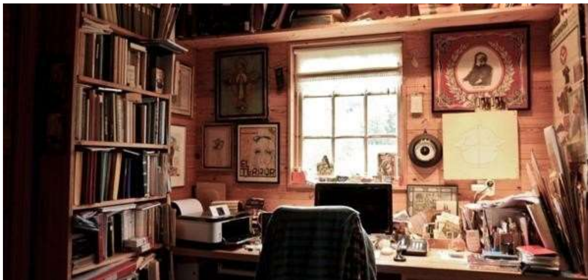
Einar Øklands arbeidsrom.

Det er ikkje berre historiske bygg som er stader for skrift. Nye skrifter vert dikta kvart år på mange stader i Hordland. Nokre av desse kan verte viktige stader for skrift også i framtida. Eitt av desse er Einar Øklands veg 136, 5554 Valevåg, der forfattaren Einar Økland bur og arbeider.