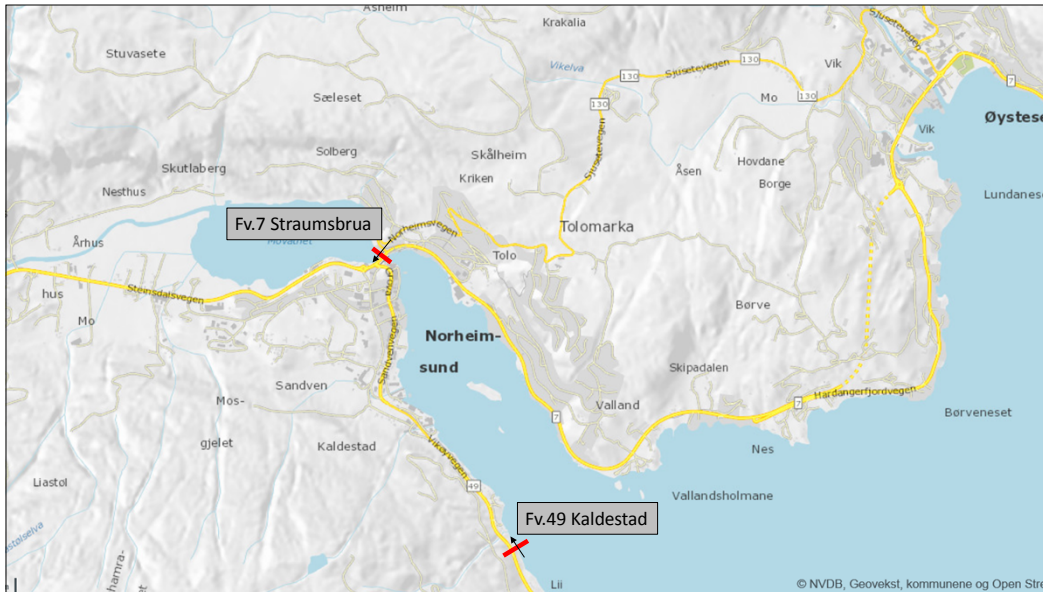
Figur 1. Framlegg til plassering av 2 nye, lokale bomstasjonar i Kvam med einvegs innkrevjing (i pilens retning). I tillegg går bomstasjon på Kjepso inn i systemet med lokale bomstasjonar (tovegs innkrevjing vert oppretthaldt).

Det er vurdert fleire alternative plasseringar.