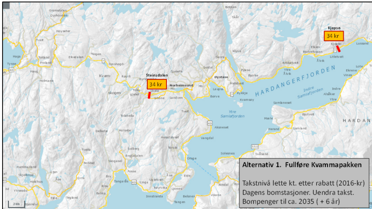
Figur 2. Prinsipp bompengesystem og aktuelt takstnivå - alternativ1.

Fullføring av Kvammapakken synast mogleg utan å innføre nye bomstasjonar og oppretthalde noverande takstnivå.