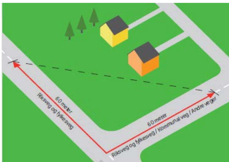
FIGUR 1 BYGGEGRENSE KRYSS