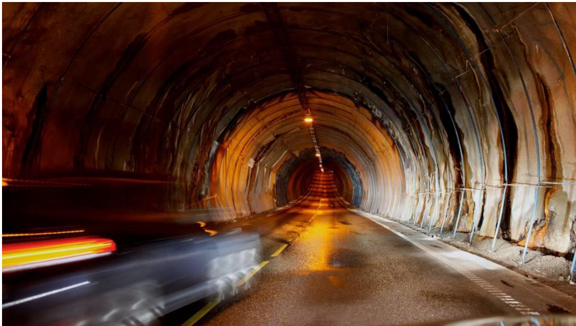
Bjørøy tunnelen.

c) Evakueringsljøs: Ei lenke av ljøs vert sett opp for å leie trafikkantar ut av ein tunnel i ein naudsituasjon. Normalt er ljosa festa på tunnelvegg i ei fast høgd over veg og med ein fast avstand mellom ljosa på kvar side av vegen