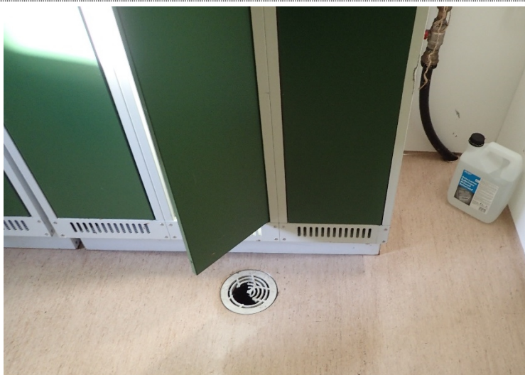
Bilde 4.12: Sluk i gulvet – garderobe- risten er ødelagt.