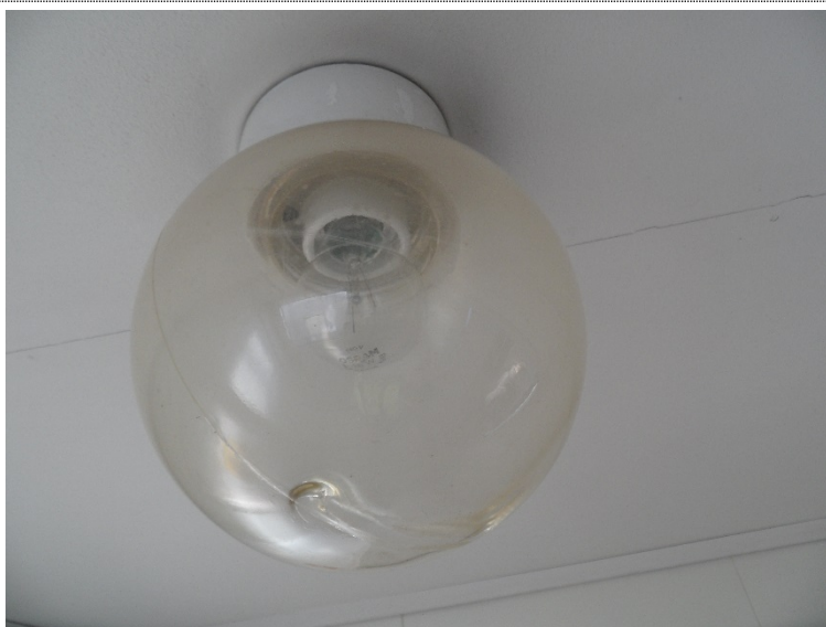
Bilde 4.6: Eldre lysarmatur med glødepære i gang.