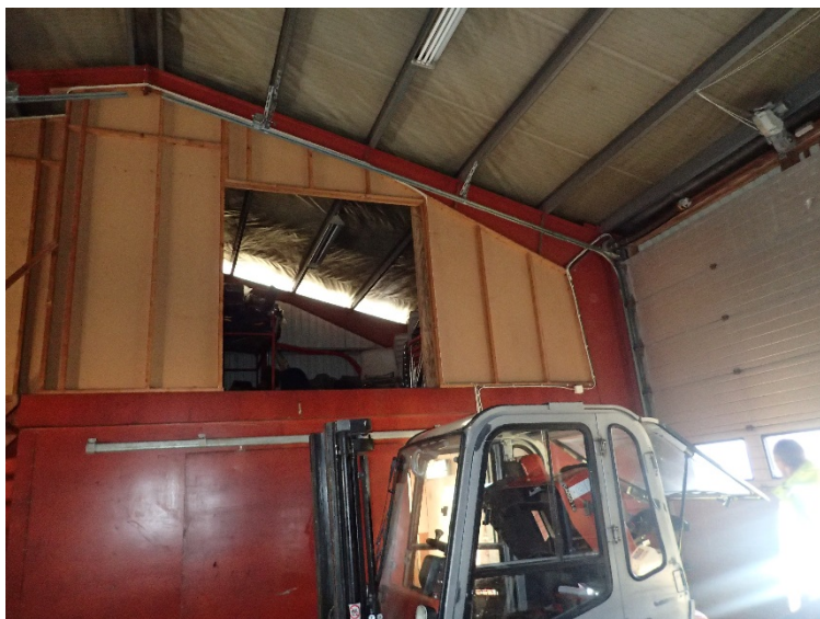
Bilde 4.4: Garasjeportene er motor styrte.