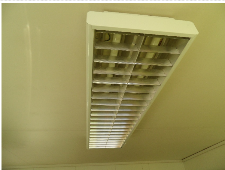
Bilde 4.5: Det er generelt i lagerhallen eldre lysarmatur med T8 lysrør.