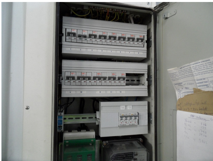
Bilde 4.2: Typisk underfordeling i lagerhall. Underfordelingene er oppgradert med automatsikringer. Forsynes fra hovedtavle i hovedbygning.