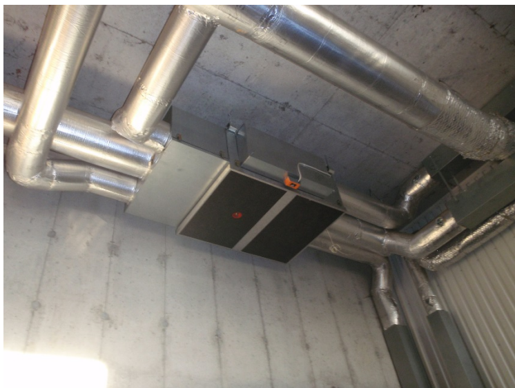
Bilde 4.13: Enkelt ventilasjonsanlegg som i hovedsak forsyner klasserommet med balansert ventilasjon. Godt isolerte kanaler