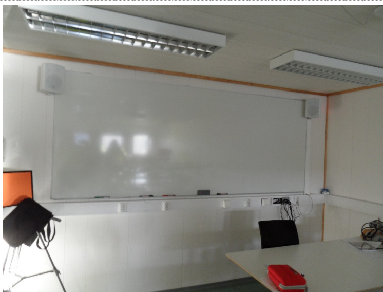
Bilde 4.3: Tilfredsstillende antall stikkontakter i undervisningsrommet.