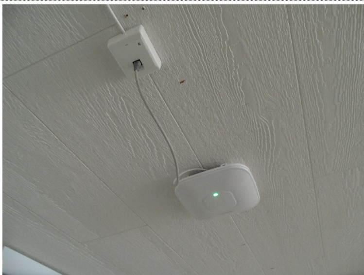
Bilde 4.8: I undervisningsrom er det faste uttak for data, samt aksesspunkt for WiFi for trådløs nettverk.