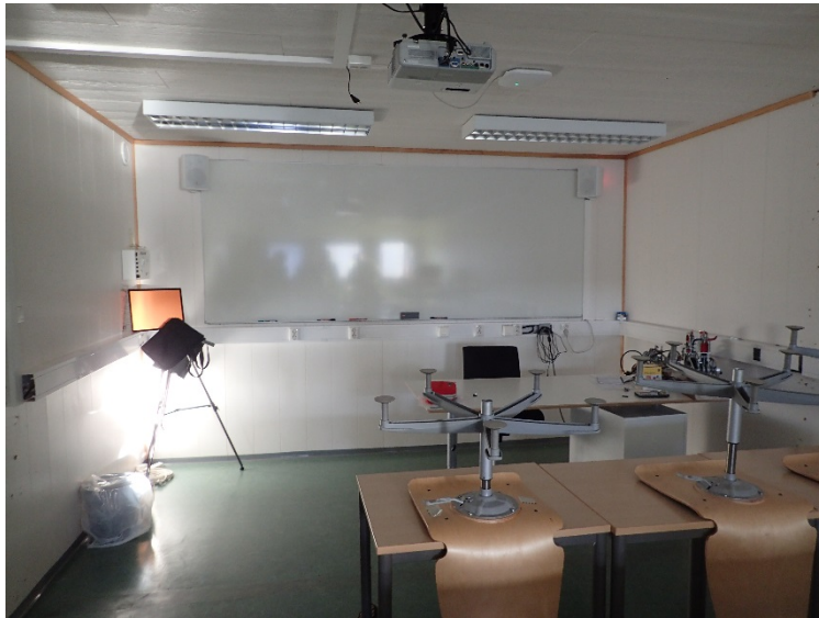
Bilde 4.1: Kabler er forlagt i kabelkanaler, som skjult og åpen installasjon. Kabelkanal i undervisningsrom mangler noen avdekninger.