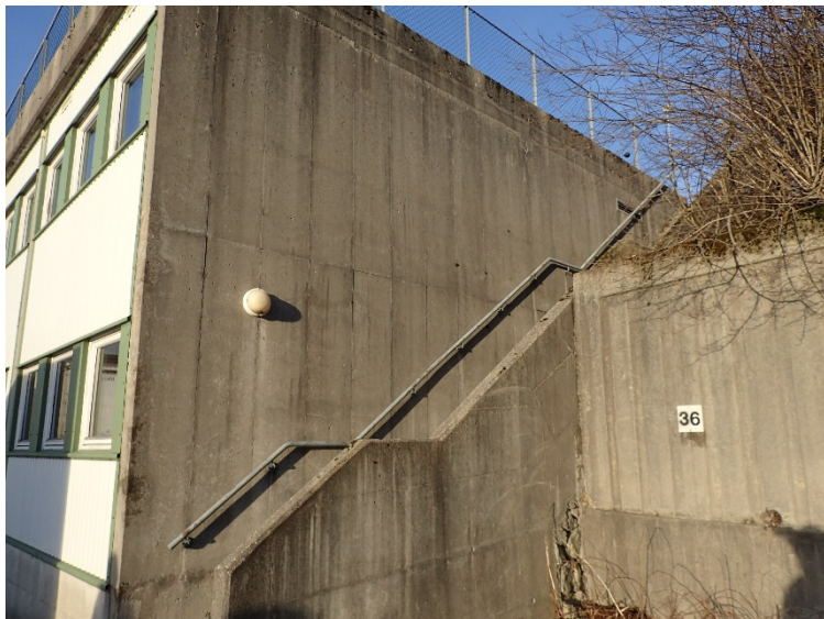
Bilde 4.10: Det er utendørs belysning i tilknytning til inngangsparti og trapp.