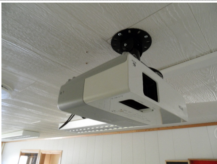
Bilde 4.9: Enkelt AV-utstyr i undervisningsrom form av projektor og White Board.