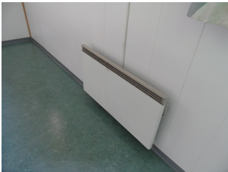
Bilde 4.7: Som oppvarming i bruksrom benyttes det gjennomstrømningsovner.