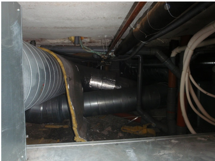
Bilde 3.13: Ventilasjon 1 etasje kontor. Plassert i kjeller. Manglende isolering og det som er av isolering er falt av.