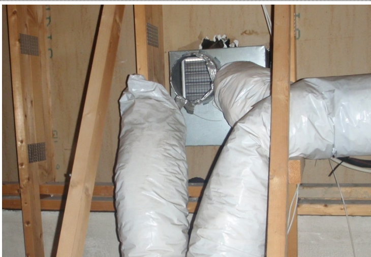
Bilde 3.9: Kanalene har falt av avkastventilen. På loftet av kontordel.