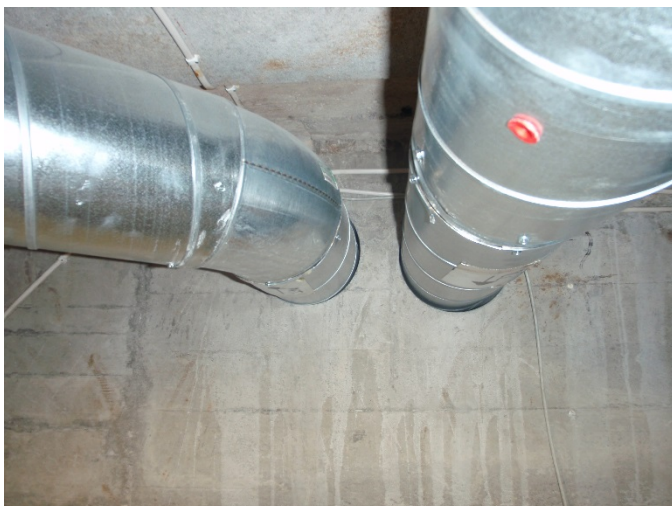
Bilde 3.14: Ingen brannisolering. Dette er en brannvegg i kjeller –hovedaggregatet til 1 etasje kontordel.