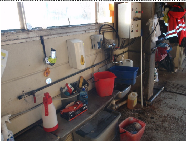
Bilde 3.3: Liten plass rundt utslagsvasker verksted.