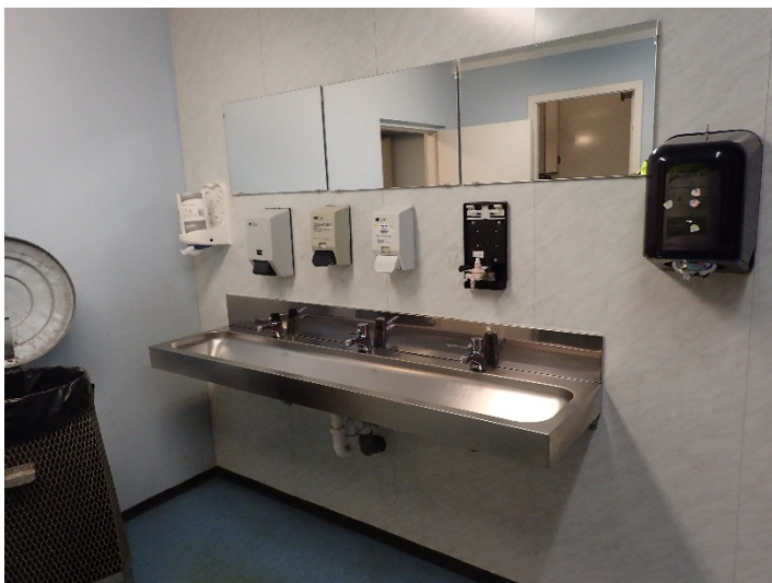
Bilde 3.2: Sanitær i god stand, men overflater er mer nedslitt.