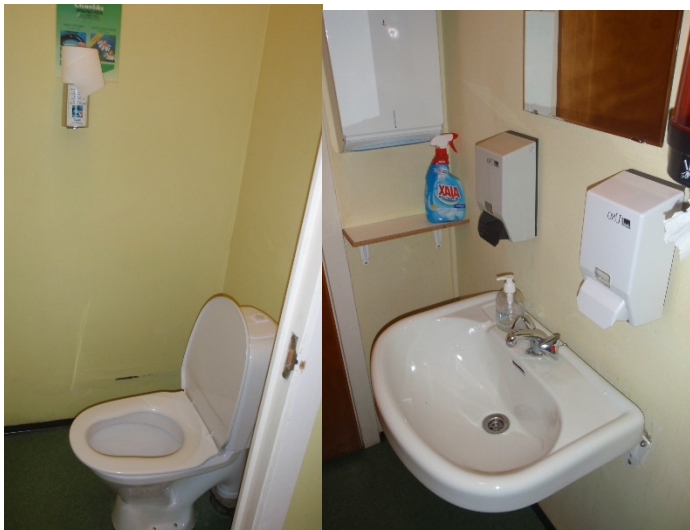
Bilde 3.1: Typiske sanitærforhold. Funksjonelt, men eldre modeller og noe slitt.