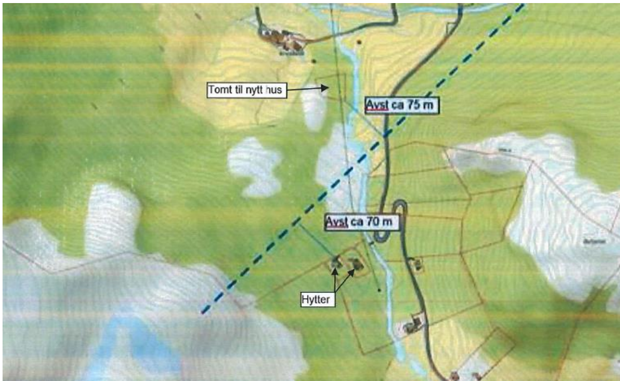
Kryssing av dalføre ved Krossvoll/Kjellbjø. Kraftlinetrasè synt som stipla line.

Dersom Gulen kommune held fast på vedtaket om ikkje å gje konsesjon til kraftliner i området kring Opdalsøyra – og det også vert resultatet etter NVE/OED si endelege handsaming av Dalsbotnfjellet vindkraftverk, medfører dette at ei eventuell kraftline følgjer trasèen som vart vedteken når NVE gav konsesjon til Dalsbotnfjellet og Brosviksåta vindkraftanlegg. Denne trasèen kryssar Gulafjorden ved Svaberget og går mellom anna gjennom Dalsbygda. Administrasjonen finn ikkje at denne løysinga er vesentleg betre for Gulen når Brosviksåta vindkraftanlegg ikkje lenger er aktuelt.