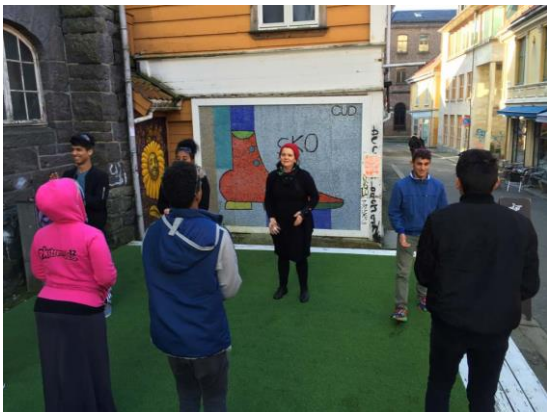
Prosjekt med mindreårige flyktninger.