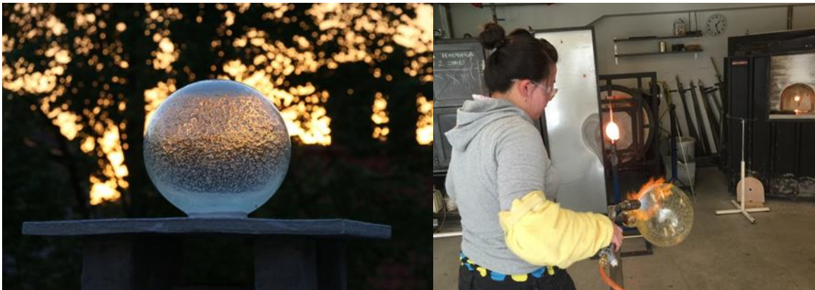
Nærbilde av selvlysendeskulptur på toppen av en pipe + arbeidsbilder fra verksted.

Sasaki hadde flere prosjekter gående under sitt opphold. Hun arbeidet også med tynne glasstråder som hun laget i verkstedet før hun sydde de sammen til en tradisjonell japansk regnjakke kalt "Mino". Videre ble deler av den Bergenske plantefloraen foreviget i glass ved hjelp av ulike teknikker. Under B-Open fikk publikum være delaktige i et av prosjektene hennes. Regnvann samlet og fryst til is ble kapslet inne i varmt glass. Når vannet smeltet blåste glasset seg opp ved hjelp av dampen og skapte organiske skulpturer. Disse ble vist frem som en del av utstillingen Pluviophile .