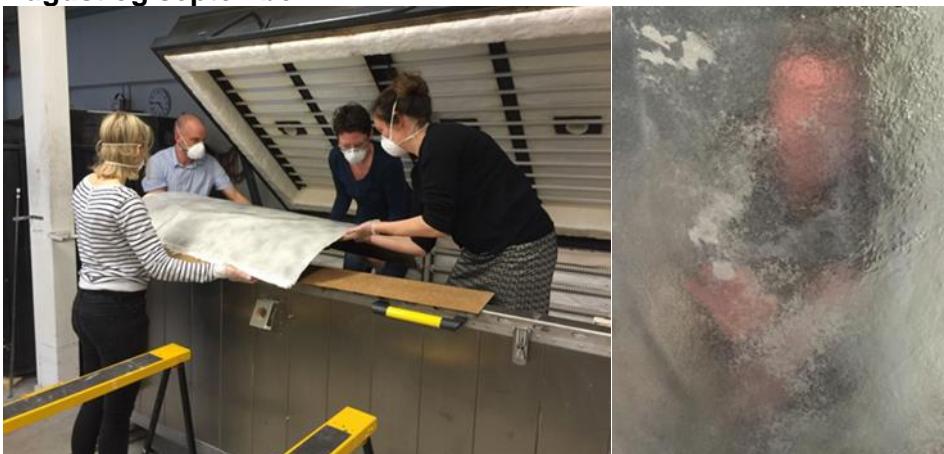
The "Shield" flyttes ut av monstret før det henges i prosjektrummet. 6 personer deltok i oppheng av det skjøre arbeidet.