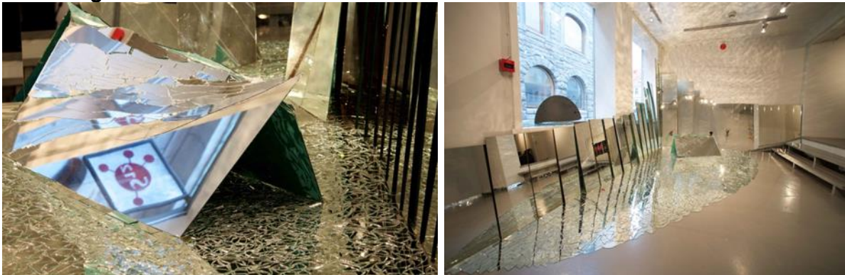
"Mirrors in Space", installasjon av Anna Lea Kopperi, 2016.