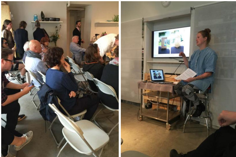
Artist talk, HANSEartWORKS.