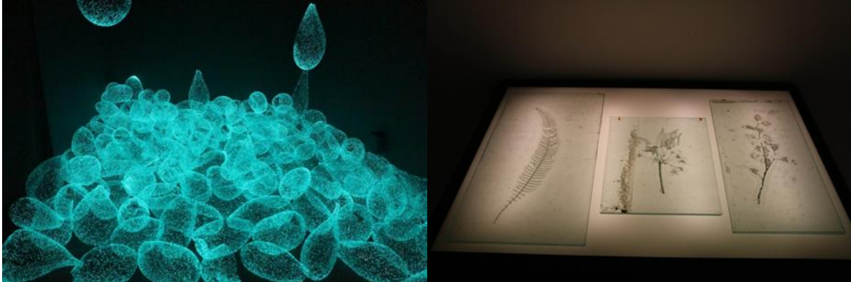
Installasjonen "Pluviophile" og "Herbarium #1: The record og weather" av Rui Sasaki 2016.

Rui Sasaki (f. 1984, Japan) er en konseptuell kunstner som hovedsakelig arbeider med gjennomskjinnelige materialer som glass og is. Hun bruker glasset som et redskap for å bevare og dokumentere «rester» av ulike typer vær, og søker blant annet etter måter å konservere, visualisere og forflytte sollys fra et sted til et annet. Selvlysende glass har fått en viktig plass i hennes arbeider.