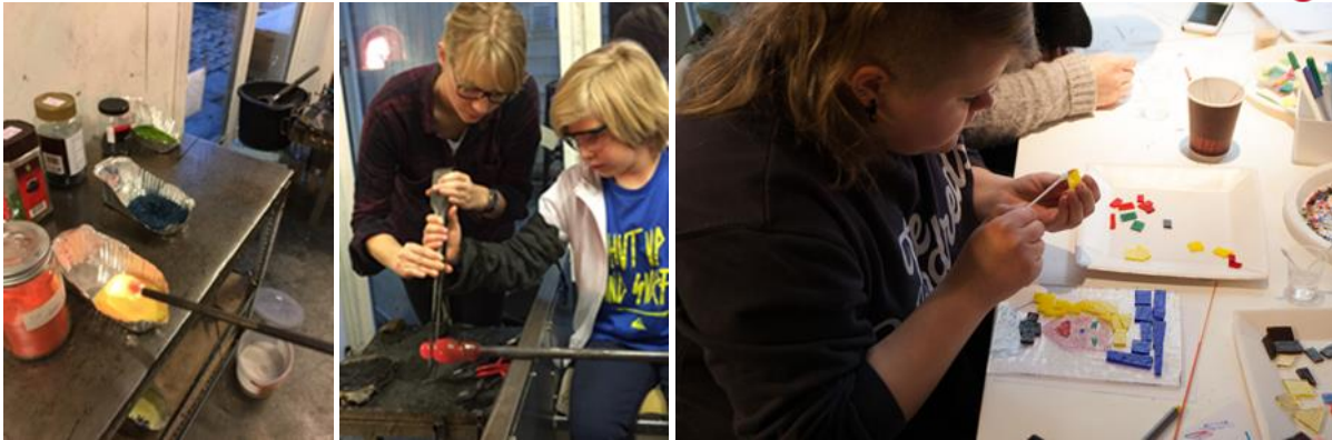
Glassblåsing på Søndagskolen og DKS – arbeid med selvportrett, 2016.

Vi har samarbeidet med Robin Hood Huset og gjennomført to verksteder for familier med vanskeligstilt økonomi, fulgt opp med gratisbilletter til alle deltakere på vårt søndagsskoletilbud. Dette viste seg vellykket da mange av familiene har blitt gjengangere som bruker av søndagsskolen. Foreningen for barn med ADHD har hatt verksted hos oss med gode tilbakemeldinger, de ønsker å gjennomføre nye verkstedbesøk neste år. Vi utarbeidet et tilbud til det tidligere flyktningmottaket på Landås om gratis deltagelse på familieverksted og søndagsskolen. Men det bød på utfordringer fordi det var sterke restriksjoner på å viderefremme tilbud hvis vi ikke hadde vandelsattest rettet til mottaket. Byråkratiet og søknadsprosessen var lang og derfor ble ikke dette tiltaket gjennomført.