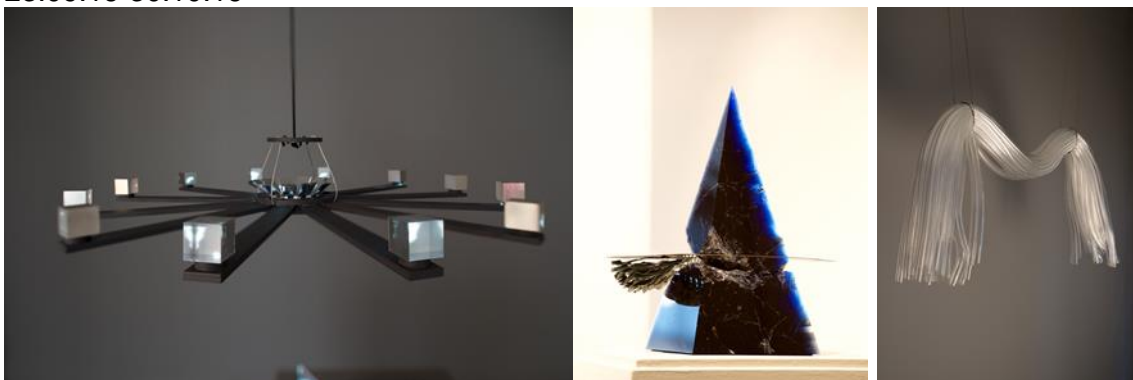
Fra v: "Lunar Echo" av Ereik Nass, "Lake I" av Patricia Sichmanova og "The Unbearable Lightness of Being" av Verena Schatz.

Young & Loving! (Y&L) ble arrangert første gang i 2007 og er en årlig utstilling med nyskapende og eksperimentell glasskunst av unge, nyutdannede glasskunstnere fra Norden