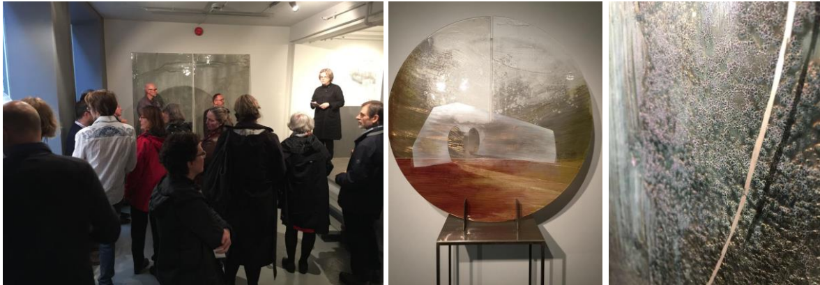
Bilder fra åpningen av Palo Macho: Med glasset som lerret.

I denne separatutstillingen ble vi kjent med arbeidene til den slovakiske kunstneren Palo Macho (f. 1965) som er blitt internasjonalt anerkjent grunnet sine unike og særegne glassmalerier. Arbeidene til Palo Macho skiller seg på mange måter fra det tradisjonelle glassmaleriet og todimensjonale bilder generelt. Macho skaper abstrakte og lyriske bilder hvor han former og bearbeider overflaten så vel som de indre lagene av glasset. Ved å blande transparent og opakt glass, og dele inn i matte og gjennomskinnelige områder skaper han et spennende og levende uttrykk som endres alt etter hvilke lys de utsettes for. Til tross for at de fleste bildene til Macho ikke har en gjenkjennelig narrativ, kan enkelte av de oppleves som usedvanlig sceniske og dermed gi betrakteren mulighet til å tillegge de egne historier. Siden ingen beskrivende titler tilbys, må vi stole på egen estetiske erfaring i tolkningen av bildet.