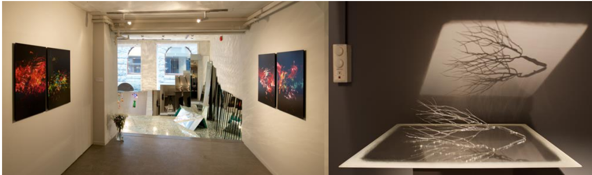
Brytninger 2016