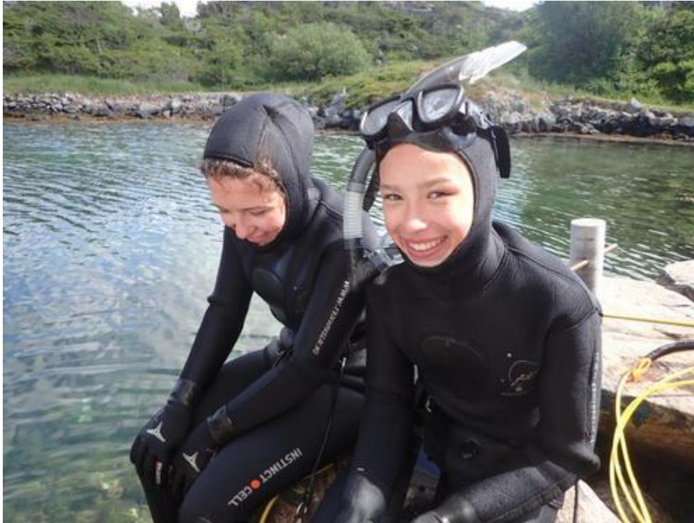
Foto: Kven vil prøve å fridykke? Det er spennande for mange å utforske det under vatnspegelen.

I DNT Ungs strategi er utstyrsutlån til ungdom et prioritert satsningsområde. Dette er også noe Friluftsrådene arbeider aktivt med. Utdrag frå DNT Ungs strategi;