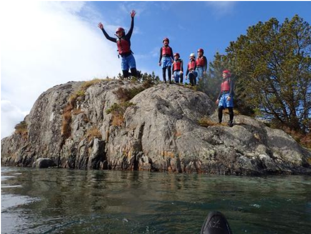
Foto: Coasteering er blitt veldig populært. Kast deg ut i dønningane frå havet.