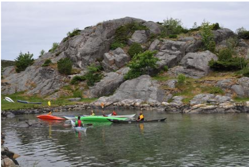
Foto: Å få tatt Vått-kortet og bli kjent med kajakk er gøy. Frå Basecamp Hav 2016.

Basecamp Hav har ein høg sosial faktor og tilbyr eit variert friluftlivstilbod. Her er eit utdrag frå ingressen til Basecamp Hav på Langøy Kultursenter 26.-30. juni 2017. Denne er fullbooka for lenge sidan og vi ønskjer å tilby mange fleire Basecampar i dei kommande tre åra.