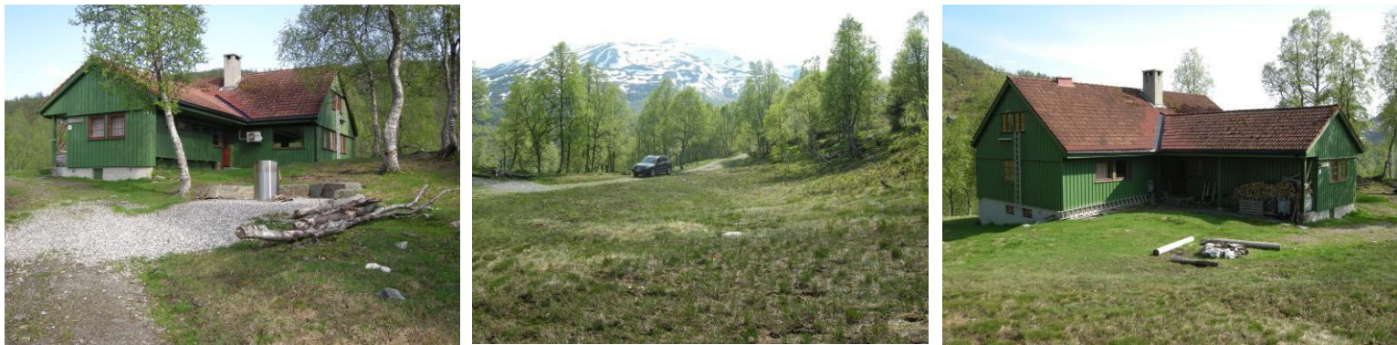
Eit fint område for uteleik og friluftsliv rundt Alexander Grieg-hytta på Hamlagrø, Bergsdalen.

Hytte vert elles leigd ut til private og organisasjonar.