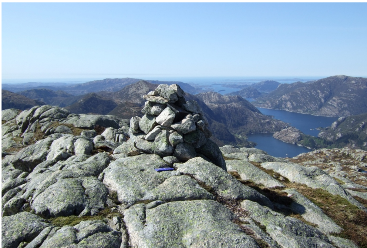
Utsikt frå toppen av Sætrfjellet, ovanfor Varden. Mot vest.