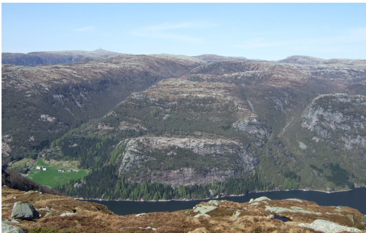
Utsikt frå Sætrfjellet mot N og Dalsbotnfjellet der vindmøllene er planlagde. Ein ser Austgulfjorden og garden Hantveit. I bakgrunnen ser ein Brosviksåta. Ø for Hantveit er det linja er planlagd.