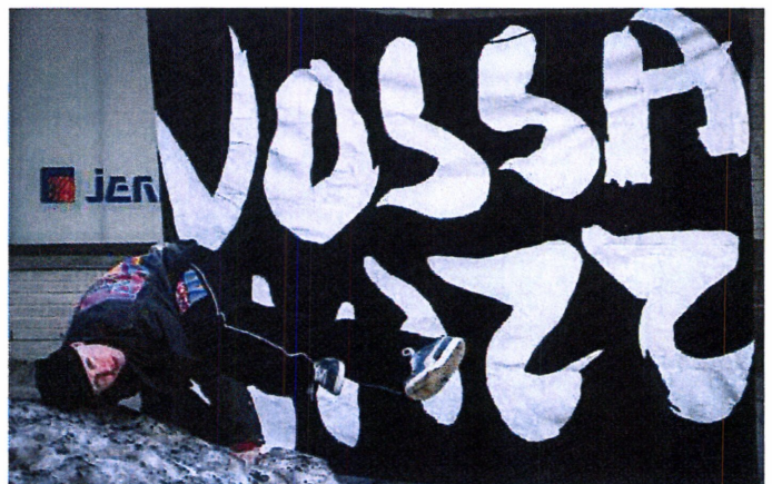
Breakdance på Vangen