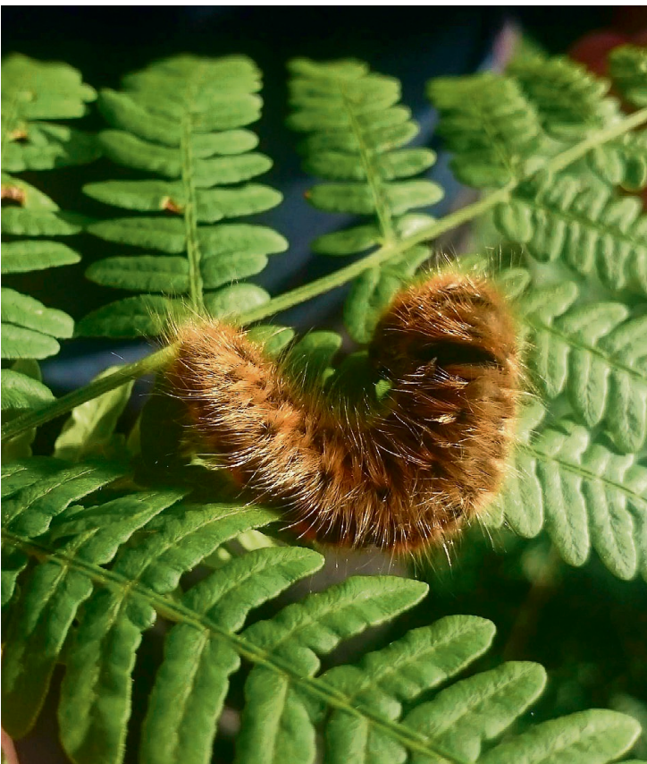
OPPLEVELSER: Malvin tar seg også tid til å utforske det som er smått, ikke bare toppene.