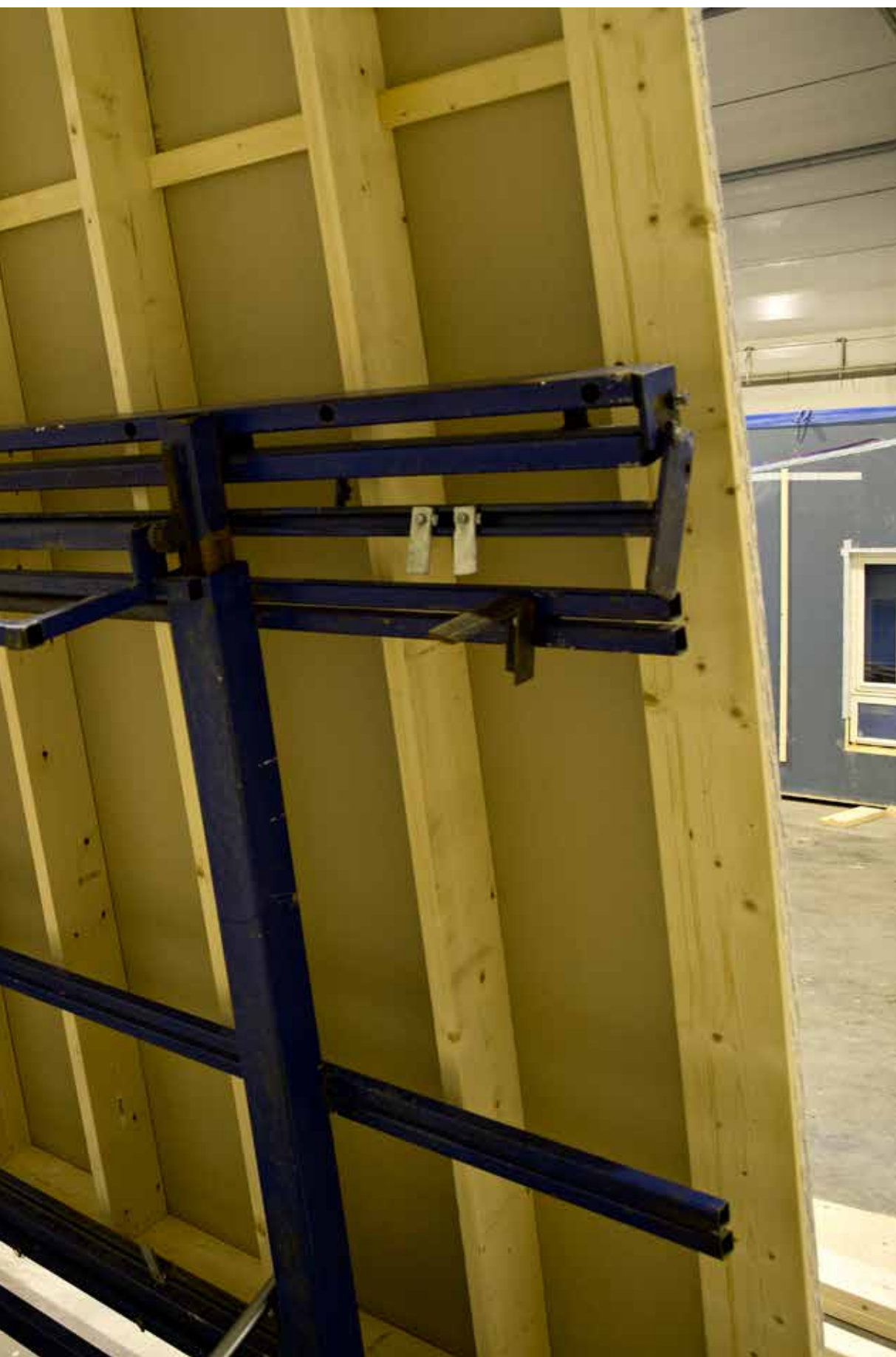
Hjelle fikk fagbrevet sitt i fjor, mens Gran er inne i sitt andre år som tømrerlærling.