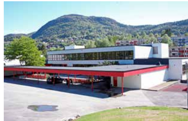
ER REDD: Foreldre frykter trafikkuhell.

BERGEN: Byrådet ønsker å bygge en midlertidig skole for 400 elever ved Damsgård skole. Brakkeskolen er planlagt å stå like ved Løvås skole. Elevene fra Damsgård skole må da busses til Løvås. Foreldre frykter for elevenes trafikk-sikkerhet hvis byrådet går inn for planen. Det skriver Sydvesten.