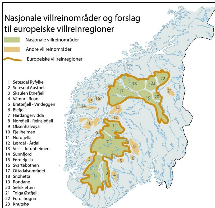
Figur 1. Nasjonale villreinområder

Slike regionale planer er etter hvert blitt utarbeidet for alle områder definert som «nasjonale villreinområder».