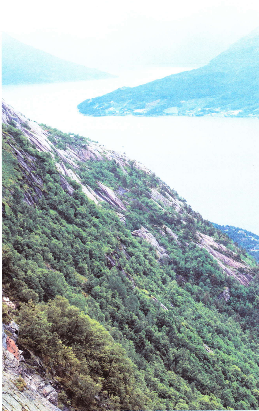
Overblikk: Frå kanten av nebbet får ein utsikt over Ålvik og Hardangerfjorden, sistnemnde 757 meter lenger nede.

– Eg gjekk der med foreldra mine for å få ein fin tur. Det er veldig kjekt at ein kan køyra opp den bratte stinginga, og så gå ein liten tur til den nydelege utsikta. Ho er heilt spektakulær. Me gjekk dit på ein veldig