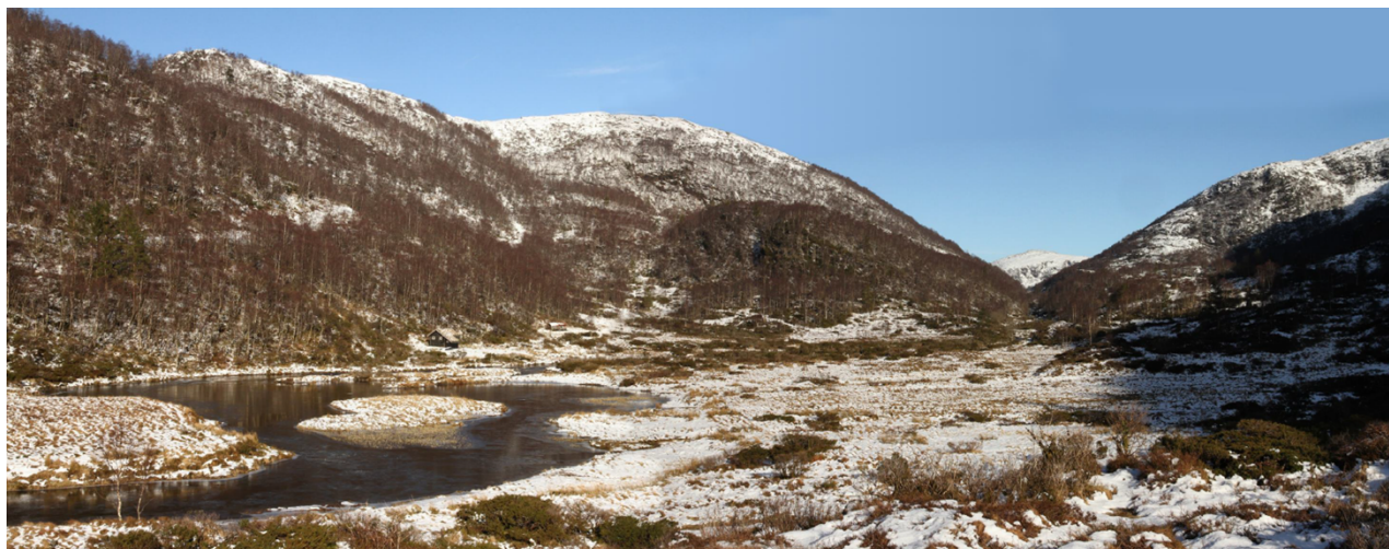
Figur 2 Myrdalen i dag