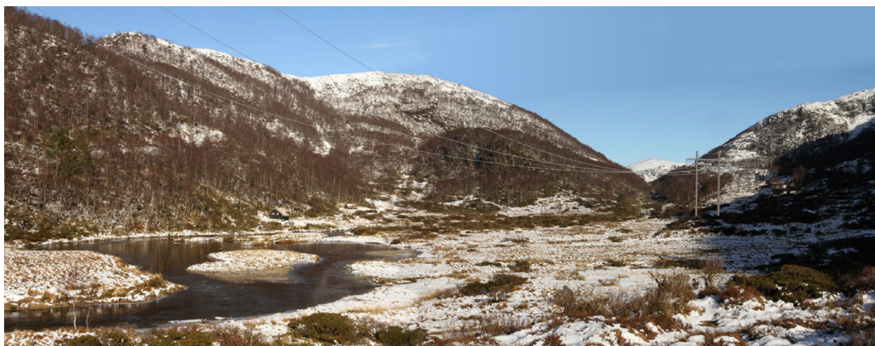
Figur 3 Kraftlinjetrase søkt om i 2015