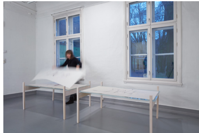
Laurisilva : Bevegelser i tid og rom.