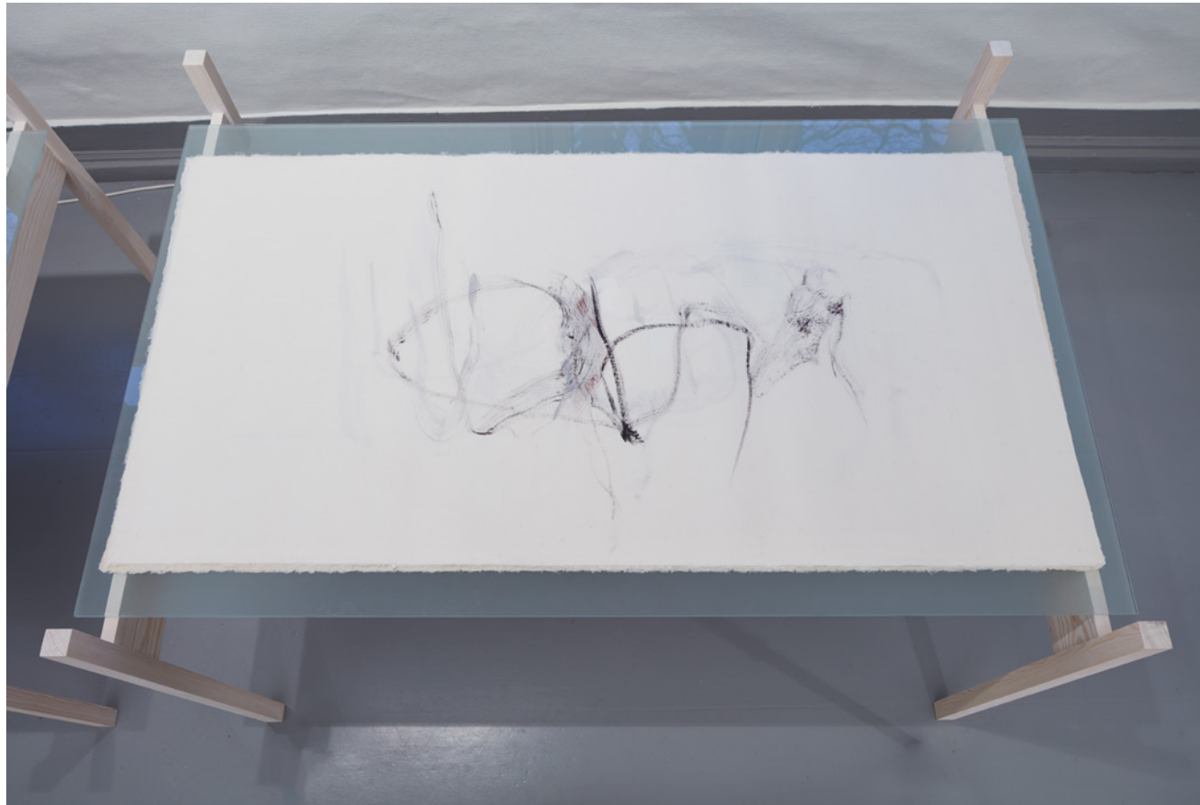
Laurisilva : Ovenfra – Betrakterens perspektiv.