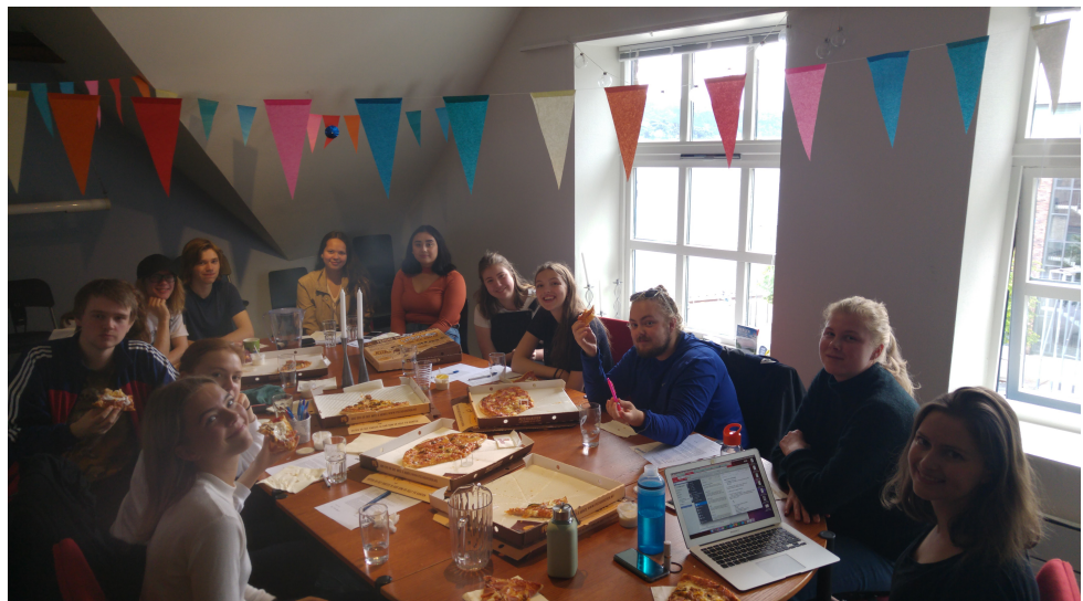
Oppstartsmøte for høstsesongen 2017

AKKS Bergen leier kontor på USF Verftet av Hordaland Musikkråd, og en andel av leiekostnadene vil tas med på UFLAKKS sitt budsjett. Det samme gjelder vår regnskapsfører i Frekhaug Regnskap som fører eget prosjektrekskap for UFLAKKS. Ettersom 20% av AKKS Bergen sin AA-stilling går med til å administrere prosjektet, er lønn og sosiale kostnader er tatt med i budsjettet under administrasjonskostnader. AKKS Bergen er en tariffbedrift.