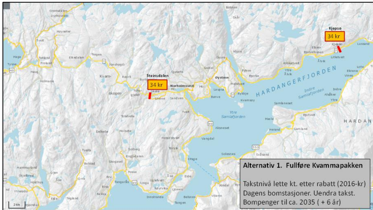
Figur 2. Prinsipp bompengesystem og aktuelt takstnivå - alternativ1.

Fullføring av Kvammapakken synast mogleg utan å innføre nye bomstasjonar og oppretthalde noverande takstnivå.