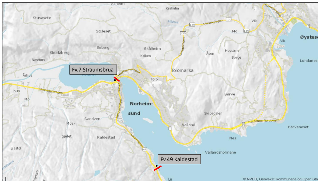
Figur 1. Framlegg til plassering av 2 nye, lokale bomstasjonar i Kvam med einvegs innkrevjing (i pilens retning). I tillegg går bomstasjon på Kjepso inn i systemet med lokale bomstasjonar (tovegs innkrevjing vert oppretthaldt).

Det er vurdert fleire alternative plasseringar.