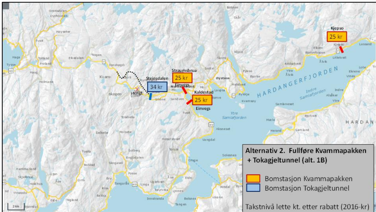
Figur 3. Prinsipp bompengesystem og aktuelt takstnivå – alternativ 2.

Dei lokale bomstasjonane i Kvam kan fullfinansiere Kvammapakken med eit takstnivå på om lag 25-30 kr. (lette køyrety etter rabatt) over ein bompengeperiode på opp mot 20 år, avhengig av rentenivå mv. For trafikantar med meir enn 30 passeringar pr. måned vert det ein fast månadspris på ca. 750 - 900 2016-kr.