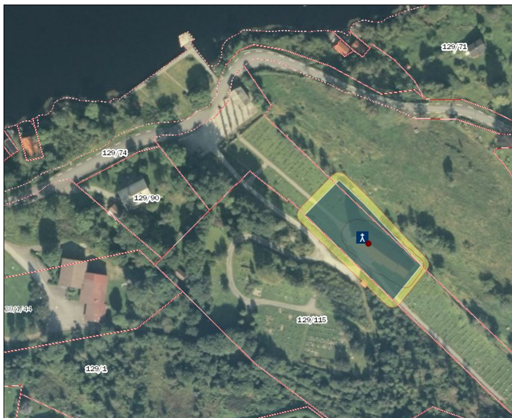
Figur 3. Kart syner mellomalderkyrkjegarden og kyrkje på Hamre som er automatisk freda. Forslag til nytt naustområde er planlagt mellom kyrkje kaien og eksisterande naust.

Tiltaket er i strid kommunen sine egne føringar for planarbeidet og som er utarbeida saman med den politiske arbeidsgruppa. Under vurderingskriterier og målsettingar som skal leggest til grunn for arbeidet med planen står det: «Det skal ikkje opnast for ny utbygging i strandsone med store verdiar».