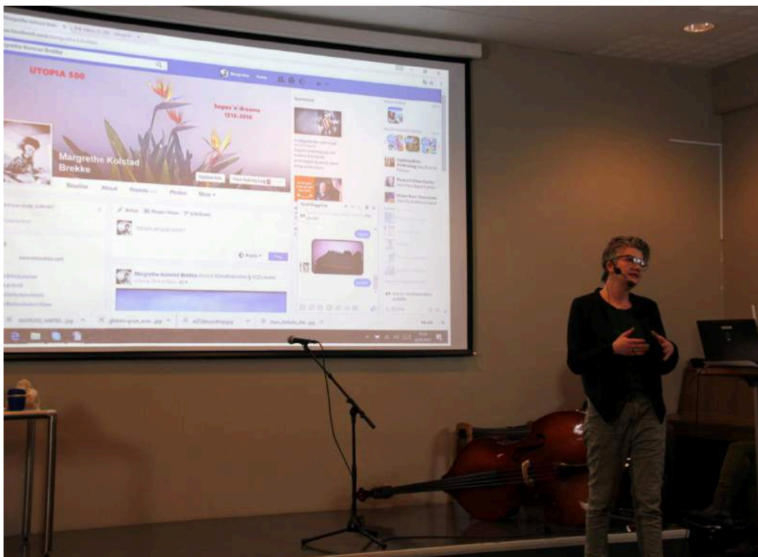
Omstillingslaboratoriet på Bergen Offentligbibliotek under Klimafestivalen, januar 2017