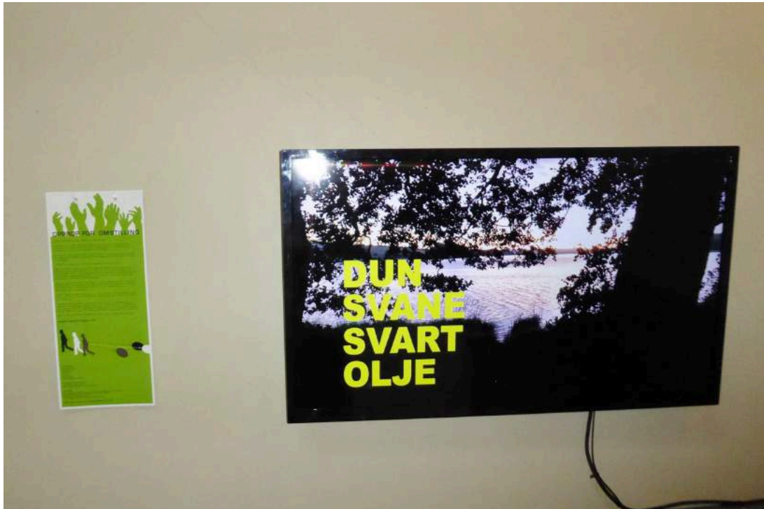
Fra utstillingen 'Opprop for Omstilling' på Kunsthall 3,14. Utstillingen sto i 3 uker.