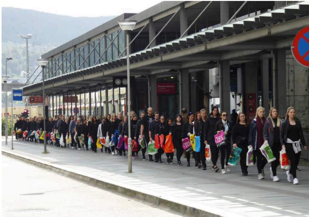
Plastikk-Parade (106 studenter fra Høyskolen på Vestlandet og Fakultet for Kunst, Design og Musikk.