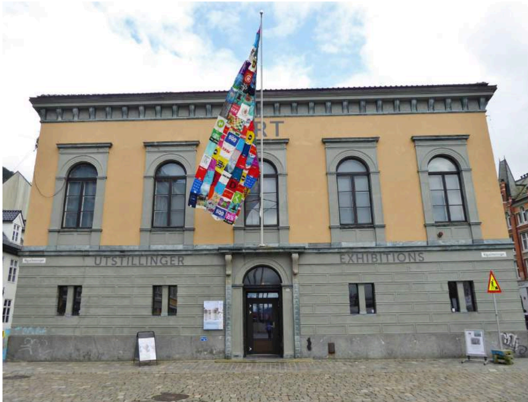
Flagg sydd av alle posene fra Platikk Paraden, flagget hang fra den 31 august til den 12.september.