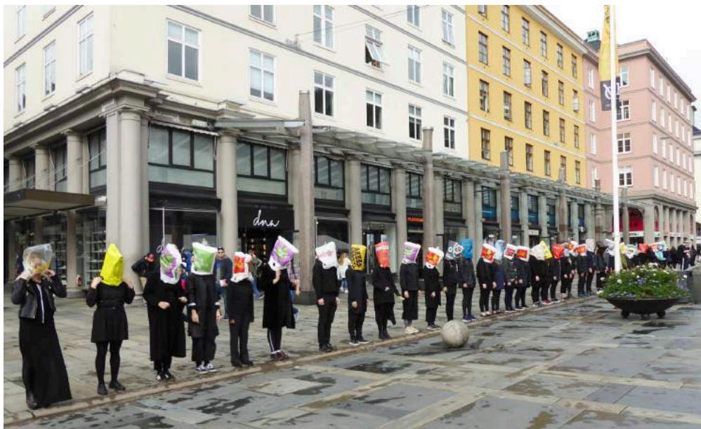
Plastikk-Paraden omringer valgbedene på Torgalmenningen