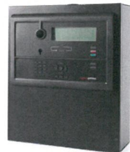
Fire Alarm Control Panel BS-200M

Tilbudet inkluderer SMS varsling ved brann eller lekkasje.