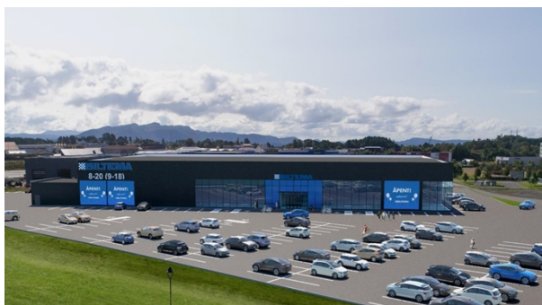
Næringskode 47.521 både Moe og Co i Bergen sentrum og Biltema

Næringskodene kan ikkje direkte overførast til Plan- og bygningslova, og kan ikkje nyttast til å skille mellom store og små vareslag, eller små og store butikkar. Vi tek utgangspunkt i regional føresegn og vurderer Biltema i høve denne.