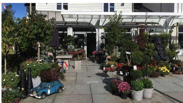
Næringskode 47.761 både Plantasjen og blomsterbutikk på torget i Osøyro.