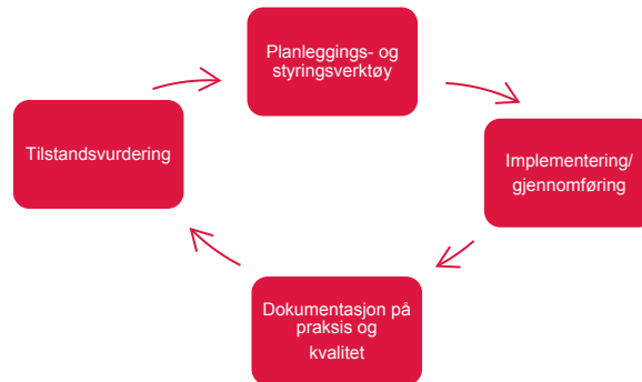
Figur: kvalitetssikring som ein syklus

Planleggings- og styringsverktøy definerer m.a. innhald og framdrift i fagskuleutdanningane. Dei mest sentrale dokument er a) Studieplan (plan for utdanninga sitt faglege innhald) og b) Plan for gjennomføringa av utdanninga (tid/stad). Andre dokument som kan ha betyding for fagskuleutdanning er nasjonale og regionale strategiplanar samt utviklingsplanar for den einsskule skule.